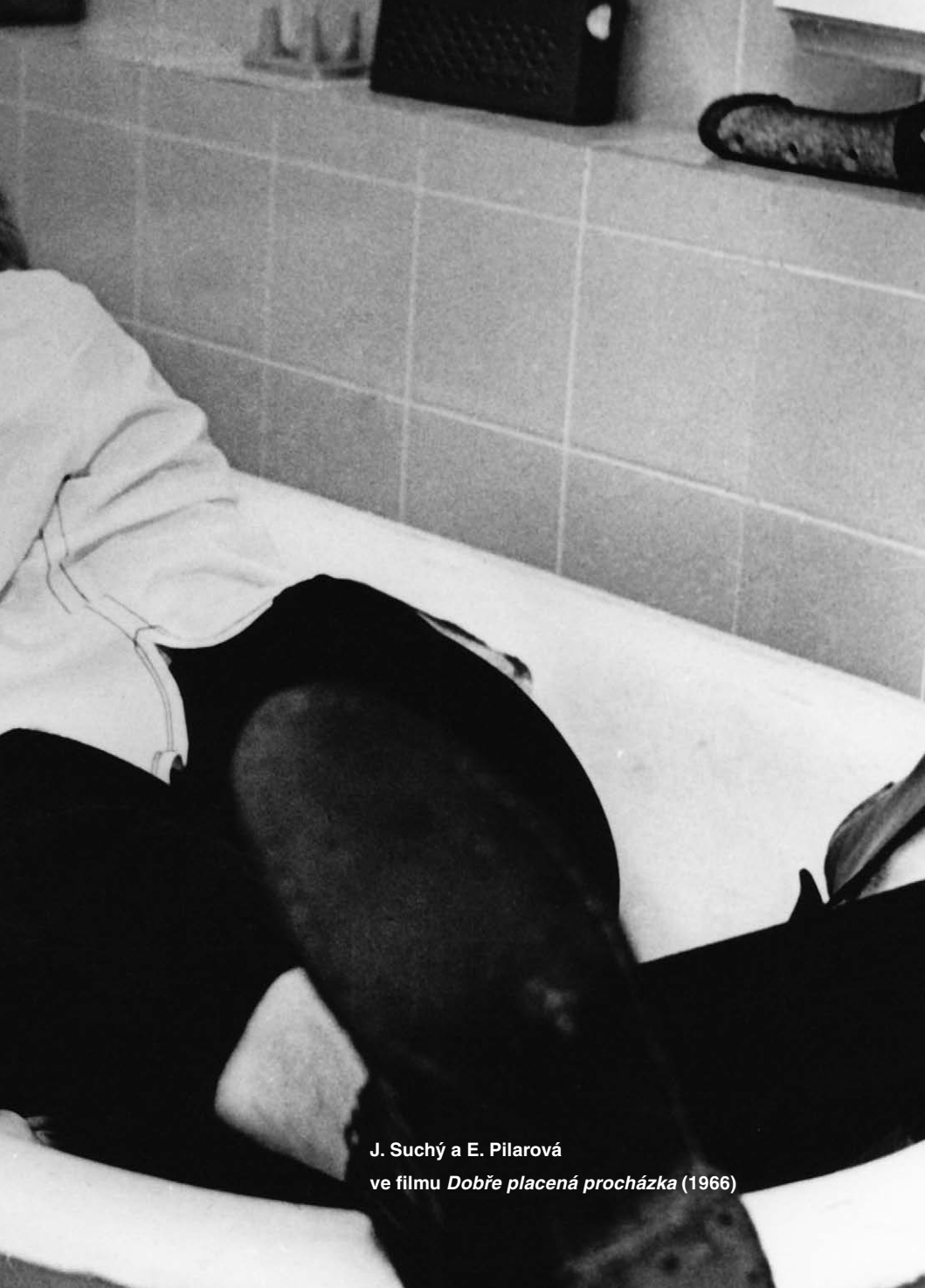
J. Suchý a E. Pilarová ve filmu Dobře placená procházka (1966)