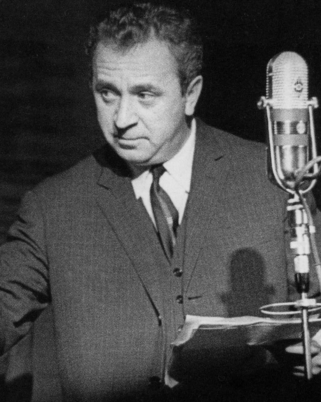
J. Suchý, J. Werich, J. Šlitr a M. Horníček