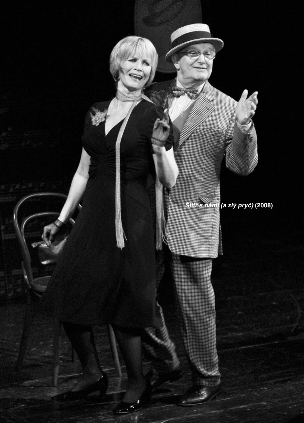
Slitř s nami (a zly pryč) (2008)