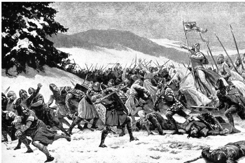
Stylová ilustrace sražení Sasů s Čechy

K té už ale nedošlo. Když Sasové šťastně prošli především Prkošovými stezkami skrz hory a vylili se do údolí pod nimi, namísto aby se šikovali k bitvě, anebo aby rychle vyrazili dál do vnitřních Čech, spokojili se jen s vydrancováním usmolených vesnic, co byly zrovna po ruce, zapadlých osad, a s nani-