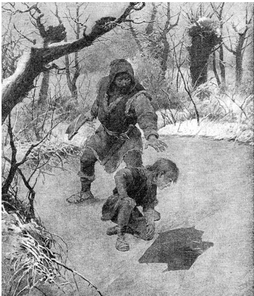
Durynk s chlapcem u ledu. (Podle V. Černého ze „Starých pověstí“)

široko odletovaly. Činil se, ale nešlo mu to. Opravdu už nebyl zrovna mladý, zadýchal se. Led byl příliš silný, trvalo to dlouho.