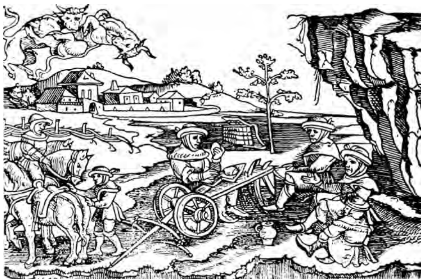
Přemysl snídající na pluhu. Ilustrace z původního vydání Hájkovy Kroniky české

jako vzácná relikvie ocitla v pražském Národním muzeu, sídlícím tehdy v ulici Na příkopě v místech nynější Živnobanky. Teprve později dospěli archeologové k závěru, že se nejedná o Přemyslovu otku, ale o keltskou železnou sekyrku, tedy předmět konec konců mnohem starší, byť nikoliv posvátný.