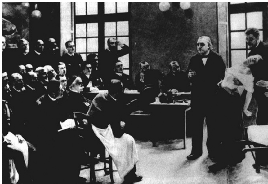
Obr. 1.1. Obraz francouzského malíře A. Brouilleta Klinická přednáška v Salpêtrière , zachycující Charcota a další významné neurology a psychiatry