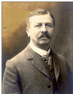
Obr. 2.1. Joseph Francois Felix Babinski, francouzský lékař (1857–1932). Jeho bibliografie je rozsáhlá. Začíná pojednáním o tyfové horečce (1882) a končí studií hysterie (1930). Babinski pracoval s velikány francouzské neurologie Charcotem, Brissaudem, Pिरerrem Marie či Déjerinem. V roce 1903 popsal příznak vějíře prstů dolní končetiny. Publikoval také texty o cerebrospinální syfilidě, mozečkových příznamech a symptomech jako je asynergie, adiodochokineze, adipozogenitální dystrofie nebo unilaterální bulbární léze

v čase. Somatické, neurologické a psychiatrické vyšetření může pomoci k určení pravděpodobné diagnózy. Nedílnou součástí je i orientační vyšetření neuropsychologické. K potvrzení nebo vyvrácení pracovní diagnózy používáme doplňková vyšetření včetně objektivní anamnézy, podrobného vyšetření klinickým psychologem a zobrazovacích metod. V případě diagnostických nejasností může být přínosné pacienta pozorovat v průběhu krátké hospitalizace.