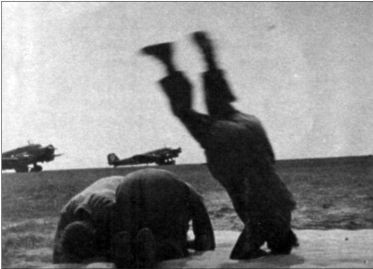
Německá letecká škola ve Stendalu, 1938. Výsadkáři cvičí pády při přistání s padákem.

vil je jako zvláštní organizaci. Zákon z 21. května také určil pro odvedence jednoroční výcvikové období. To bylo nezbytné, protože scházel dostatek vojáků z povolání. O patnáct měsíců později už rozvoj branných sil umožnil prodloužit povinnou vojenskou službu na dva roky. V říjnu 1937 měla aktivní německá armáda 500 000 – 600 000 mužů ve zbrani a skládala se ze čtyř armádních skupin, 14 armádních sborů a 39 divizí, včetně čtyř divizí motorizované pěchoty a tří tankových (obrněných) divizí. Také bylo k dispozici 29 záložních divizí, jež mohly být v případě mobilizace povolány do služby. Počet záložních divizí postupně vzrůstal, jak byli muži po skončení povinného výcviku uvolňováni z armády. 3