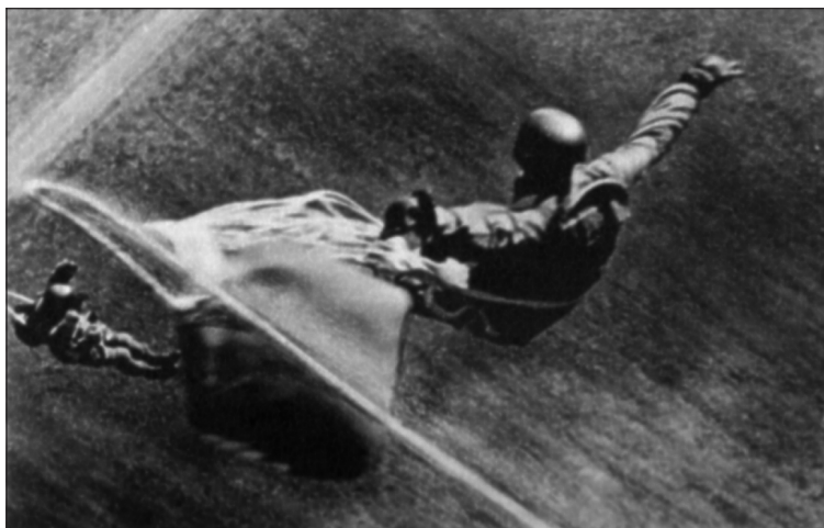
Německá letecká škola ve Stendalu, 1938. Němečtí výsadkáři ve vzduchu. Všimněte si kožených rukavic k ochraně rukou.