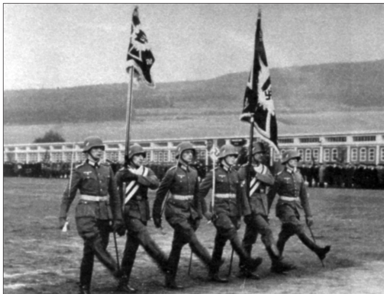
Velitelé 31. a 57. ženijního praporu na přehlídce v roce 1937.