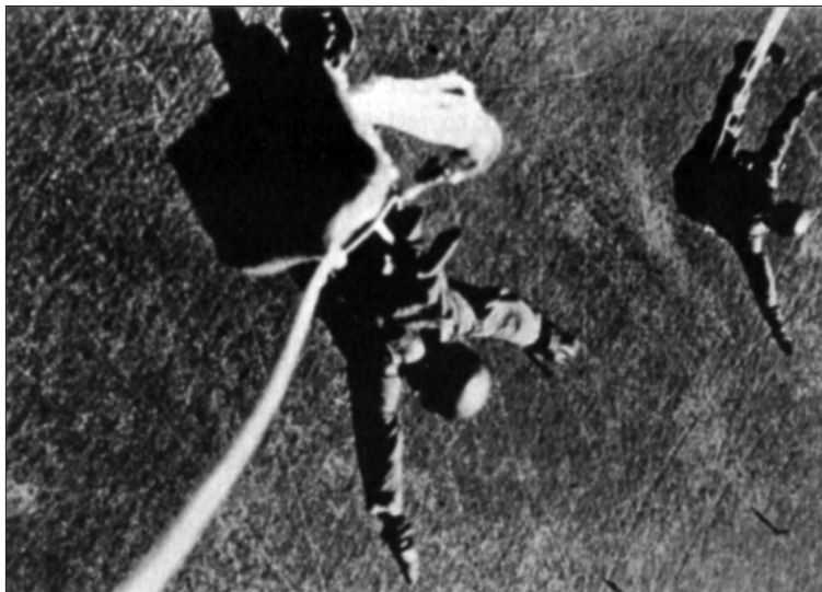
Německá letecká škola ve Stendalu, 1938. Německý výsadkář při seskoku, v poloze s roztaženýma rukama i nohama.