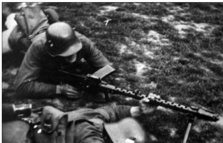
Výcvik střelby z kulometu v 16. ženijním praporu v roce 1935.

Vedla tak i své děti, i když nám ponechávala dostatečnou volnost. Usilovně pracovala. Pěstovala na zahradě zeleninu a všechno