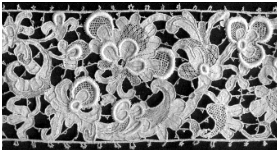
■ obrázek 7 Benátská šitá krajka (17. stol.)

Těsné kontakty mezi panovníky a předními velmoži vedly také k určité unifikaci v módě a výtvarném umění. Tím bylo dáno i poměrně rychlé rozšíření krajek v 16. století. Jakmile se objevily na dvorském oděvu v jedné zemi, záhy se začaly napodobovat i v zemích sousedních. A protože byla výroba krajek složitou záležitostí, nejprve se krajky dovážely, teprve později se budovala domácí výrobní střediska. K většímu rozvoji výroby v nových zemích došlo v 17. a 18. století především tam, kde proběhla reformační, nebo kde bylo nábožensky tolerantnější prostředí, které lépe přijímalo přicházející krajky z Flander a Francie. Výjimkou bylo jedině Španělsko, kde se vytvořila vlastní výroba z domácích, katolických zdrojů. Ze všech těchto důvodů má vývoj paličkované krajky v západní Evropě společné rysy a interpretovat ho lze jedině vcelku jako jeden kulturní a umělecký fenomén.