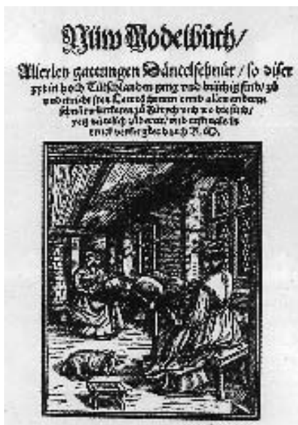
■ obrázek 2 Vzorník krajek Nüw Modelbuch (Zurich, 2. pol. 16. stol.)

Další datovaný vzorník z této doby byl vydán roku 1527 v italském městě Cologne. Jde o malý osmerkový svazek s 42 tabulka-