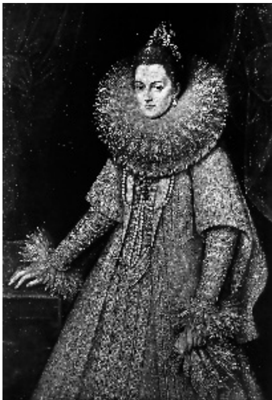
■ obrázek 6 Šaty s okružím (pozdní 16. stol.)

I když je zřejmé, že technika výroby paličkovaných krajek byla v pozdním středověku alespoň omezenému okruhu výrobců známá, objevuje se sporadicky. Důvod je ovšem zřejmý. Krajka ve středověku nesloužila jako módní doplněk. Románské a gotické oděvy byly střídme a pokud se na nich objevovaly zdobné prvky, bývaly často předmětem kriti-