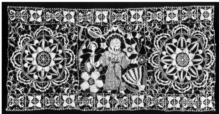
■ obrázek 3 Reticella - šitá krajka (Anglie nebo Španělsko, začátek 17. stol.)