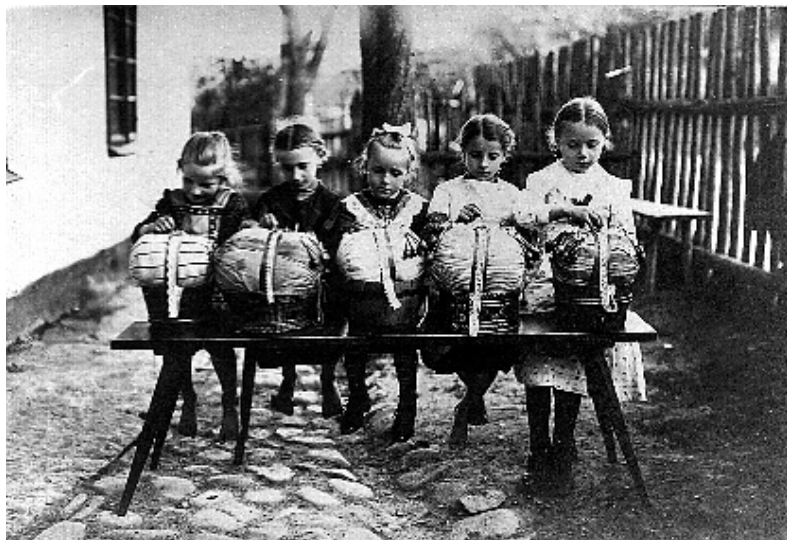
■ obrázek 1 Vamberecké děti na počátku 20. stol. (MK Vamberk)

Ve městě Bruggy žila krásná dívka jménem Serena. Milovala mladíka jménem Arnout, ale nemohla si ho vzít za muže, protože musela stále sedět u kolovrátku a příst, aby užívala své čtyři sestry a čtyři bratry. Byla smutná a nešťastná. Až jednou se při procházce posadila pod strom, zasnila se a usnula. I strom zesmutněl a uronil stříbrné nitě, které na její zástěrce vytvořily překrásný vzor. Serena doma ustříhla nit z kolovrátku a upalíčkovala krajku s tímto vzorem. Krajka byla tak zvláštní a krásná, že ji hned koupil bohatý kupec. A tak Serena paličkovala další a další krajky se vzorem, který jí napověděl sen, spánek a strom. Mnoho lidí pak její krajky kupovalo a Serena zbohatla. Vzala si Arnouta za muže a žili spolu šťastně až do smrti.