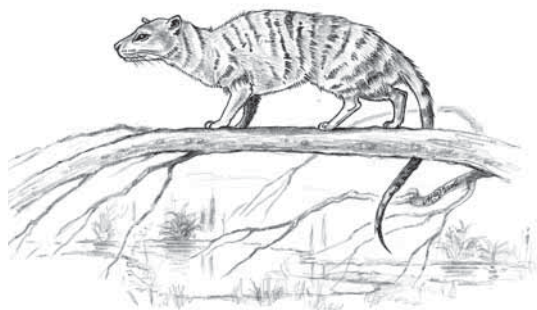
Miacis – malá stromová šelma, pramáti kočkovitých šelem

Za předchůdce našich domácích koček je všeobecně považována kočka plavá ( Felis lybica ). Většina mumií nalezených v obrovském počtu v Egyptě byla právě tohoto druhu divoké koč-