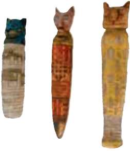
Egyptské mumie koček

děpodobně tu hrála určitou roli nenávisť církve vůči severskému kultu bohyně plodnosti Freyi. Jisté je to, že mnoho žen – údajných čarodějnic – našlo svou smrt na hranici společně se svými kočkami.