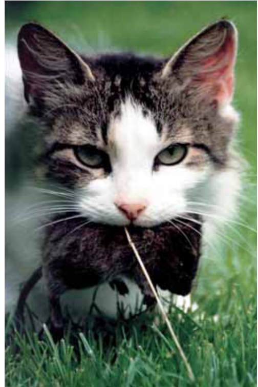
Pracovní kočka v plném nasazení – její prací je lov