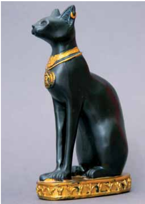
Soška bohyně Bastet

lovecká činnost kočky je daleko ekologičtější, protože nemá žádné negativní vedlejší účinky na životní prostředí – na rozdíl od chemických přípravků. Dnešní užitečnost koček ale spočívá především v tom, že jsou objektem chovatelského zájmu mnoha lidí a kočka se stala jedním z nejoblíbenějších domácích mazlíčků.