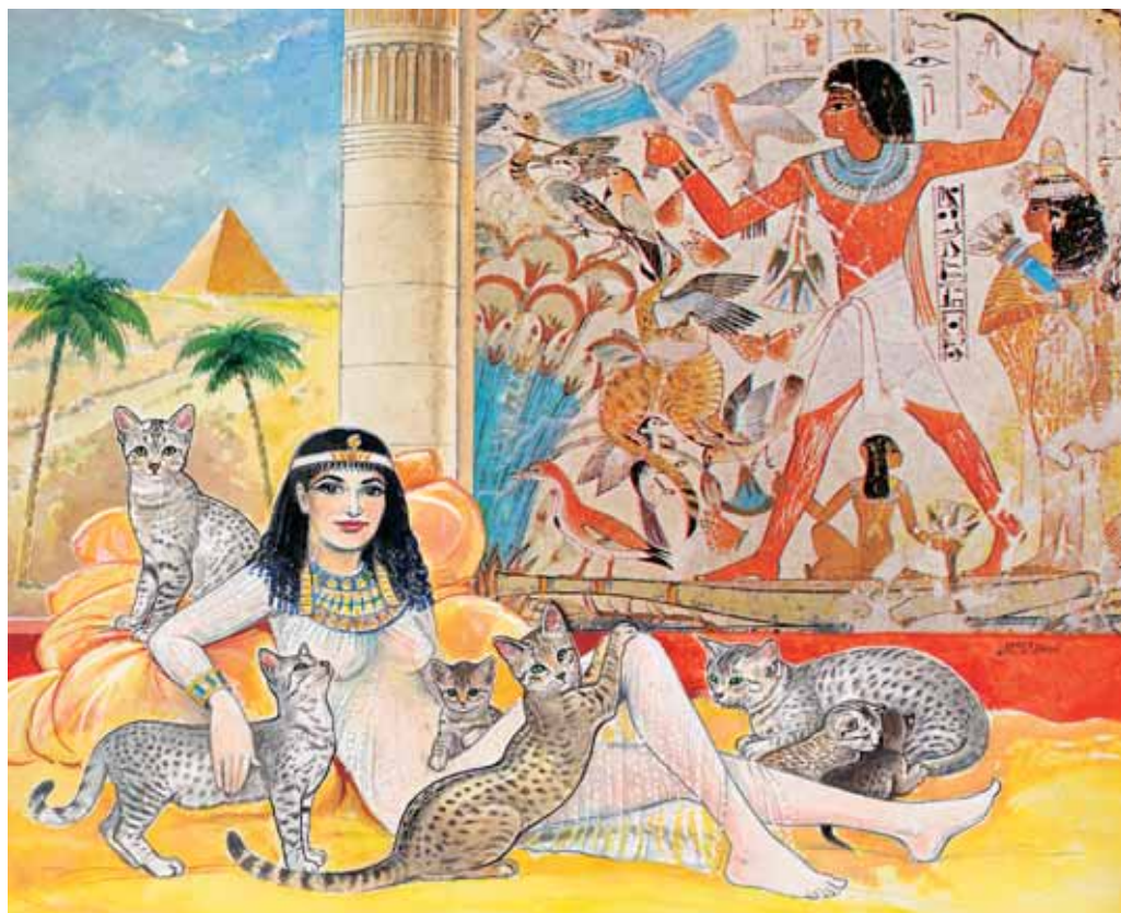
Takto nějak mohly kočky žít v egyptských palácích (freska je dochovaná). Kočky se tehdy zřejmě podobaly dnešní egyptské mau, která byla vyšlechtěna právě podle podoby egyptských koček