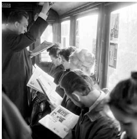
Četlo se i v tramvaji