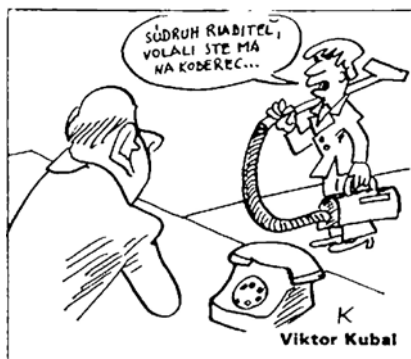
Kresba z Roháče, 1966