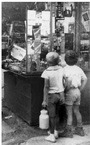
Cestou do mlékárny je potřeba si něco přečíst