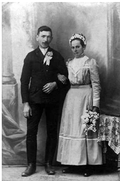
Šťastní novomanželé, 1910

Žil padesát let v harmonickém manželství. Babička byla jeho největší láskou. Největší babiččinou láskou byli námořníci. Byla to šetrná hospodyňka. Zakázala dědovi pít jeho oblíbenou značku piva a kupovala jen tu nejlevnější. Vzpomínám si, že děda měl jisté hudební vlohy, rád tancoval a obstojně hrál na fujaru. Zemřel nedostatkem posluchačů, kamarádů – vrstevníků.