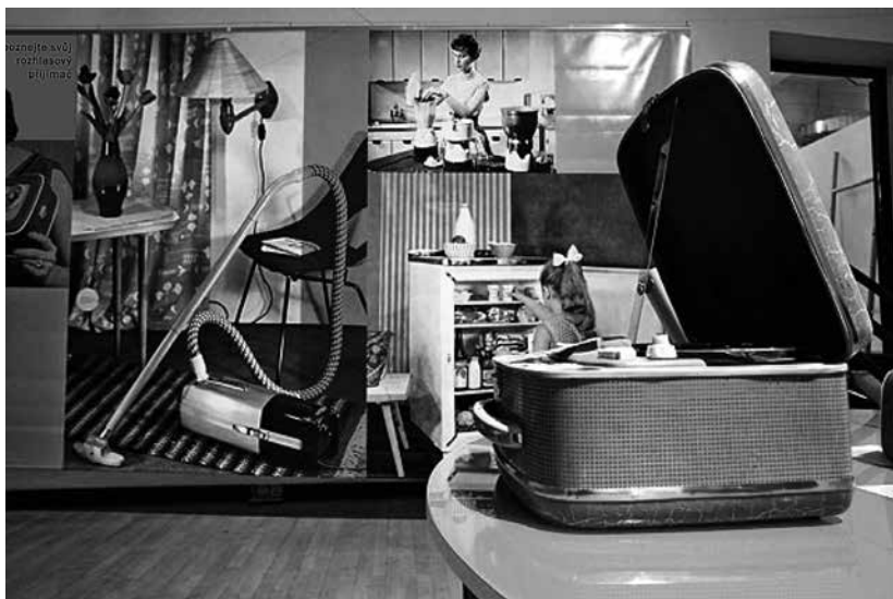
Na trhu se objevily nové spotřebiče pro domácnost

Padesátá léta, charakterizovaná reálným socialismem se vším, co k němu patřilo včetně politických procesů, stalinských čistek, ale i začátků rokenrolu, končí a začínají léta šedesátá. Jaké to vlastně bylo období? Vyjádřeno velmi stručně, prostřednictvím barevného spektra, byly to barvy veselé, optimismus a radost ze života. Šedesátá léta dostala přívlastek zlatá. Blahodárná šedesátá léta, na která pamětníci vzpomínají s nostalgií, tak označují současníci za mýtus vytvořený hipisáky, kteří hlásali volnou lásku.