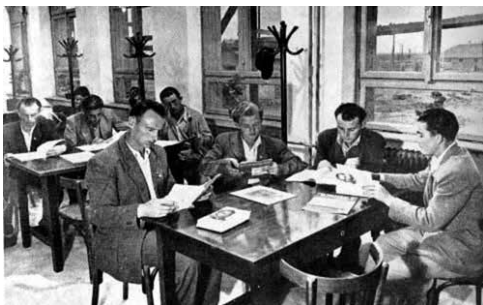
Kolektivní čtení literatury socialistického realismu

Celá šedesátá léta byla jedním velkým převratem v myšlení lidí, ke kterému výrazně přispěla i literatura. Naši slavní spisovatelé zůstali někde v předcházejícím desetiletí u budovatelských románů socialistického realismu. Četli jsme hlavně Remarquea, Camuse, Robbe-Grilleta, Kerouaca, Ferlinghettiho, Ginsberga, Moraviu, Greena, Sartra, Passoliniho či Hellera.