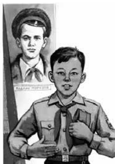
Пioneer — честный и勇敢的 товарищ, всегда смело стоит за правду.