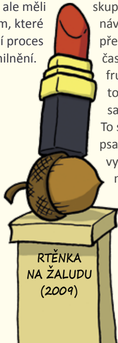
RTĚNKA NA ŽALUDU (2009)

skupiny i hrdelní zločiny typu návštěvy galerií a divadelních představení. Zejména muzea často bývají zdrojem zbytečné frustrace – na leckteré výstavě totiž najdete exponáty, které sami ještě běžně používáte. To se pak člověk fakt cítí pod psa. A jestli mermomocí hodláte vyhazovat peníze za beznadějně překonané tradice z dob dávno minulých, vstupte radši do komunistické strany nebo mužského pěveckého sboru.