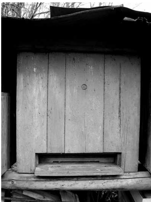
Starý nedělitelný úl