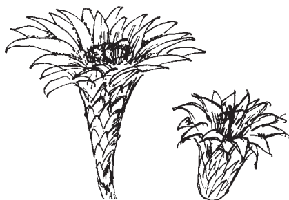
Obr. 2 Tvary květů: trubkovitý (vlevo), trychtýřovitý (vpravo)

Květ samotný má pochopitelně i vnitřní – anatomickou stavbu. Uvnitř, v tzv. jícnu, se nacházejí samičí a samčí pohlavní orgány, tj. pestík s bliznou a tyčinky nesoucí prašníky. Pod bliznou a čnělkou se nalézá semeník s vajíčky – středobod všeho. Pylová zrna, zpravidla z cizích nepříbuzných jedinců téhož druhu, se pomocí opylovače usadí na blizně a začnou prorůstat směrem k vajíčkům. Po oplození vajíčka samčí pohlavní buňkou ukrytou v pylovém zrnku dojde k vytvoření semene a celý proces vyvrcholí zráním plodu a distribucí semene do okolí.