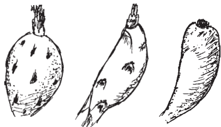
Obr. 3 Ukázka různých tvarů plodu

Pomineme-li suché pukavé plody, jaké má např. rod Turbinicarpus (u jehož zástupců se o šíření semen víceméně nikdo nestará), zjistíme, že většina ostatních plodů je uzpůsobena tak, aby sloužila jako potrava živočichům, kteří následně zajistí distribuci semen. Ne náhodou je proto řada plodů dužnatých a velmi chutných. Na jedné z našich četných zastávek v severním Mexiku jsme narazili na opuštěný polorozpadlý domek, jakých jsou v této oblasti stovky. Byl však zvláštní tím, že jeho stěny byly pokryty téměř souvislou vrstvou uschlého ptáčího trusu. Už na první pohled bylo zřejmé, že tyto pozůstatky po ptácích pocházejí z doby, kdy v okolí zralý plody kaktusu Mammillaria potsii . Jejich semena totiž v trusu dominovala, což dokazuje více než jasně pravdivost tvrzení o výhodné spolupráci rostlin a živočichů.