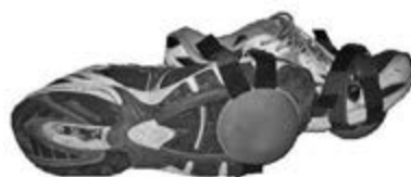
uchycení na obuvi pro tréninkové využití

Pro tréninkové využití je typické umístění balančních polokoulí v přední polovině obuvi. Čím blíže ke špičce boty, tím je cvik účinnější a náročnější. Posuneme-li polokoule do centra podélné osy chodidla, získáme balanční prostředek, který má preventivní a léčebný účinek na hluboké zádové svaly kolem páteře a na hlezenní i kolenní kloub.