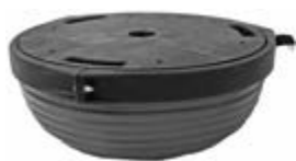
obrácená balanční polokoule