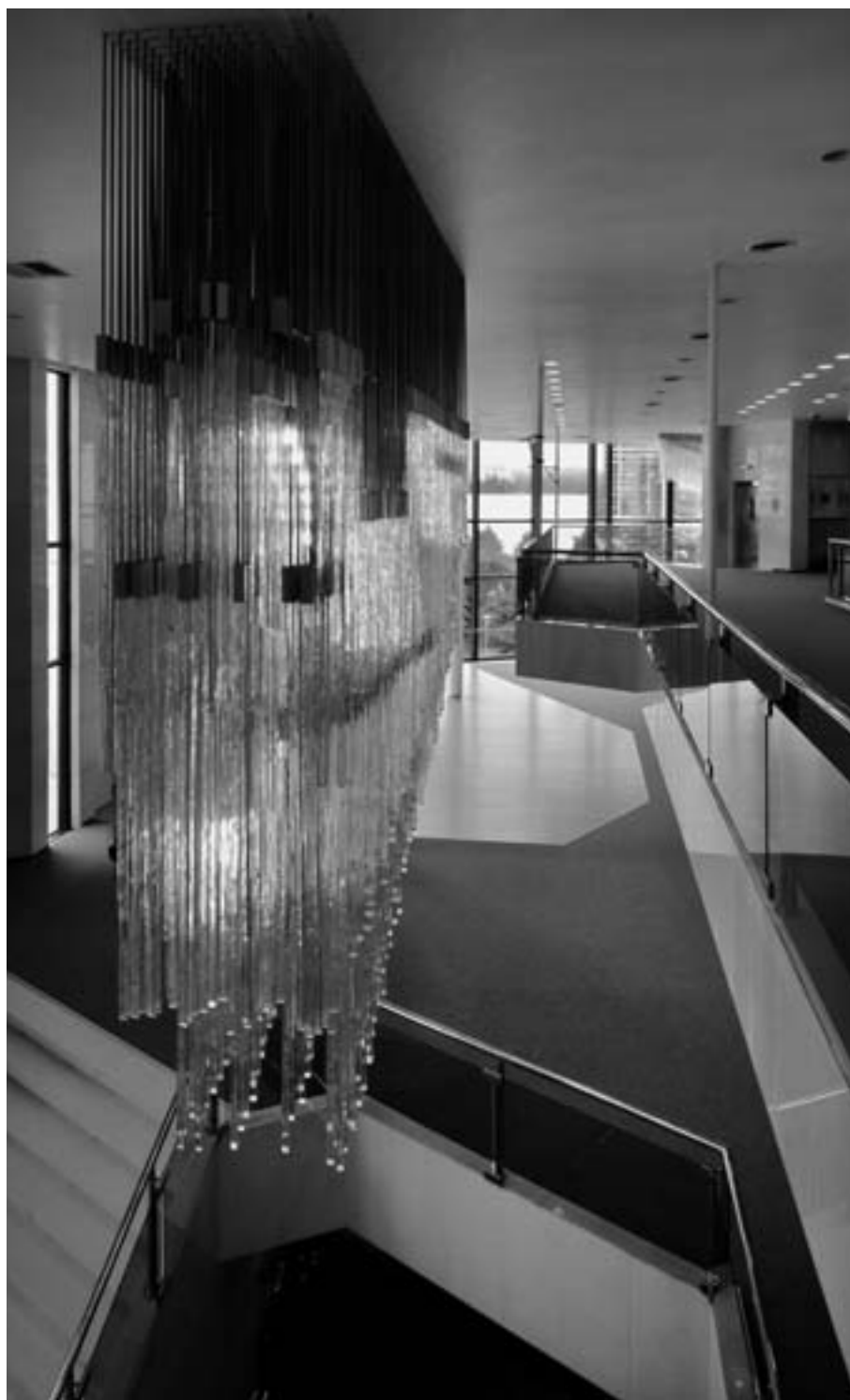
Foyer divadla v Mostě se světelným objektem René Roubíčka, foto- grafie Roman Polášek