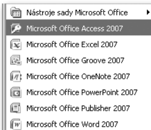
Obrázek 2.1: Zástupce programu Access v nabídce Start