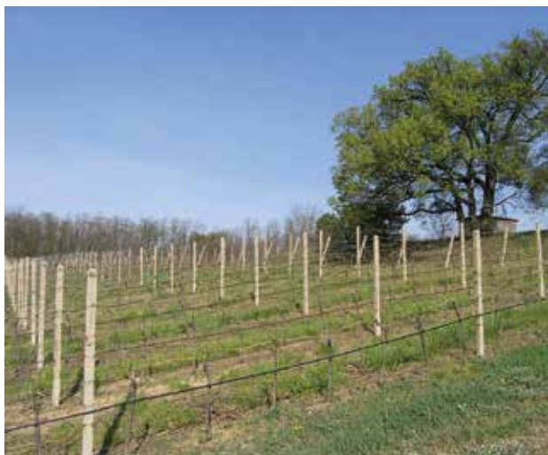
Stošíkovice na Louce, viniční trať U tří dubů

Oblast Znojemska leží v deštivém stínu Českomoravské vrchoviny tvořené prahorními útvary, jejichž výběžky daly na mnohých místech vzniknout kamenitým půdám vynikajícím pro pěstování bílých odrůd. Její nejvýhodnější výspou je Bobravská pahorkatina, okolo které jsou roztroušeny nejseverněji položené vinohrady této podoblasti.