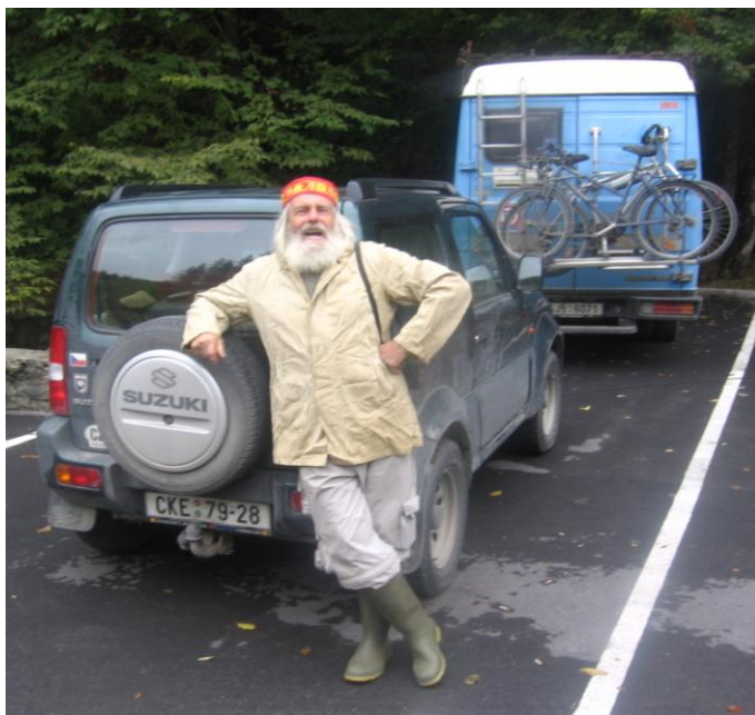
Autor a vehikly Jimny a Med'our