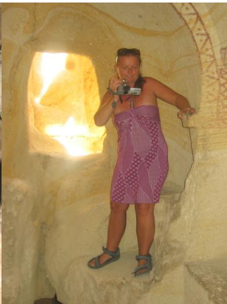
Šárka ze mlejna