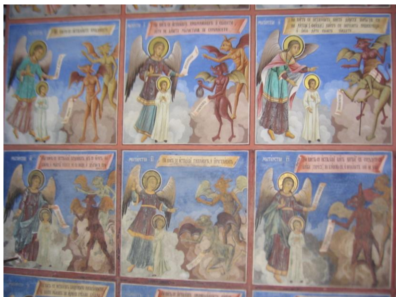
Zápas nebe s peklem