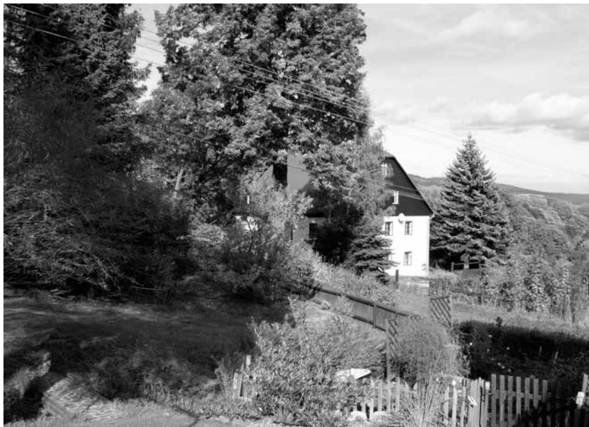
Horská vesnice Boxgrün – Srní dnes