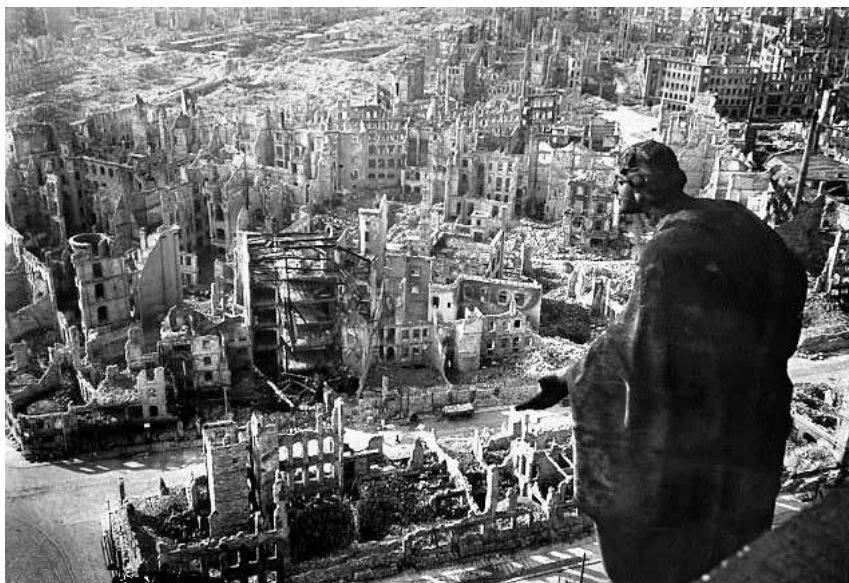
Drážďany po bombardování