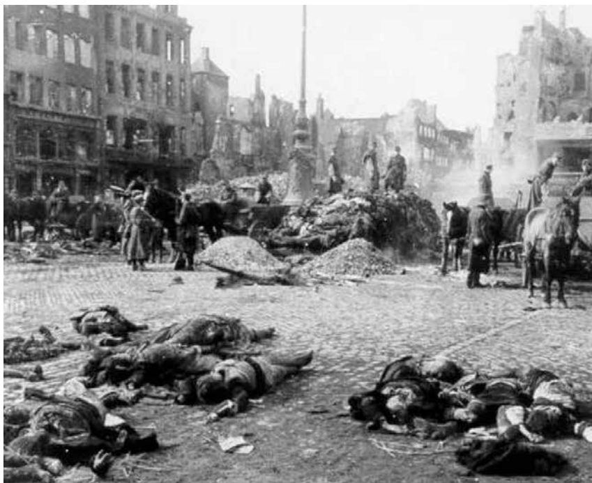
Oběti bombardování v Drážďanech