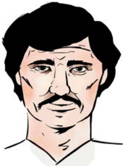
Giordano Bruno dle představ ilustrátorky.