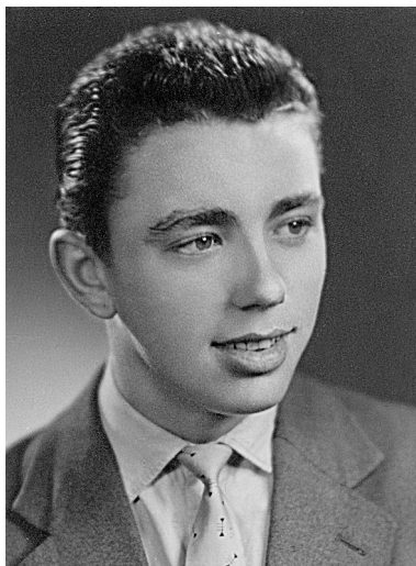
Student havlíčkobrodského gymnázia.