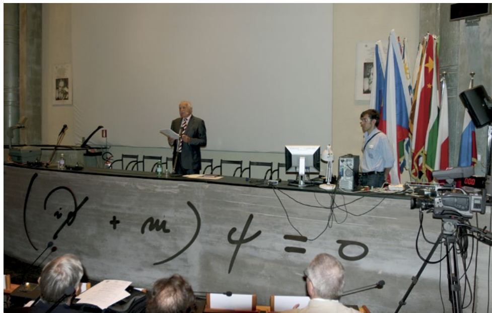
Projev v šíleném vedru.

arabské architektury, hlavním pokrmem je kuskus s rybou, který si člověk také spíše spojuje se severní Afrikou.