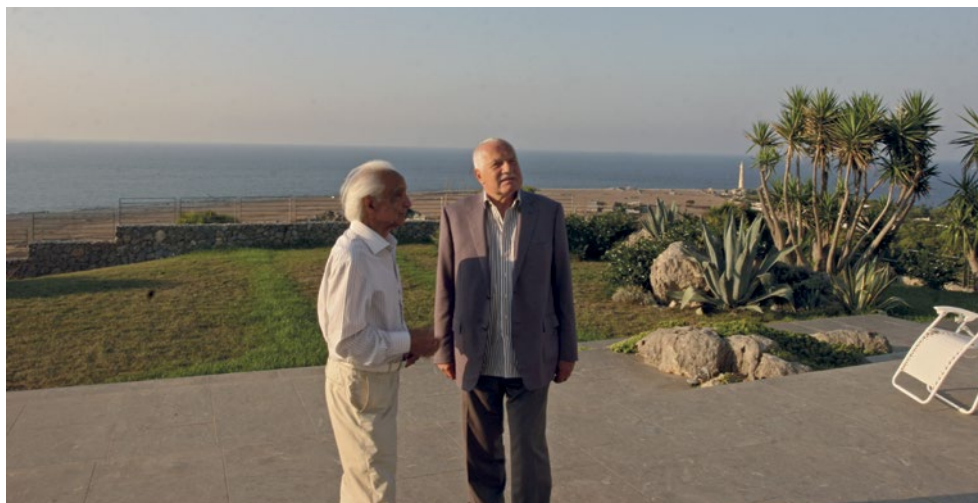
S profesorem Zichichim.

přímořském městečku San Vito Lo Capo na večeri, vzpomínal, co mu řekl Fermi, co John von Neumann, co Teller, co spousta dalších slavných jmen. Vůbec jsem netušil nic o vědě na Sicílii, určitě ne o matematické škole v Palermu známé od konce 19. století, která dala prof. Zichichimu dobré matematické základy.