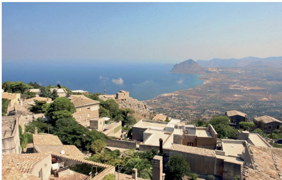
Pohled na Trapani.

Sicílie – jako jeden ze čtyř italských autonomních regionů – má 5 milionů obyvatel, tedy zhruba polovinu České republiky. HDP na hlavu zde dosahuje jen o něco více než polovinu úrovně střední a severní Itálie. Míra nezaměstnanosti se blíží k 20 %, zaměstnaná je jen jedna žena ze tří. Do věku 24 let nemá práci více než 50 % mladých lidí.