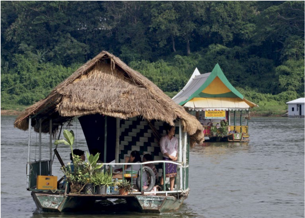
Lodě plující po jednom z ramen Mekongu.

V Laosu mnozí z nás nebyli, já také ne. Je to podobně jako Česká republika země bez přístupu k moři, ale s jednou z největších řek světa – Mekongem, který spojuje celou jihovýchodní Asii. Země je svou rozlohou třikrát větší než ta naše, ale má jen něco přes 6 milionů obyvatel. Země je to historicky stará, první státní útvar, království (jmenovalo se moc hezky – „Království milionů slonů a bílého slunečníku“), tam vznikl již v roce 1353. Od konce 19. století byl dnešní Laos součástí Francouzské Indočíny, což definitivně skončilo až spolu s koncem vietnamské války. Laoská lidově demokratická republika – dodnes komunisticky orientovaná – vznikla v roce 1975.