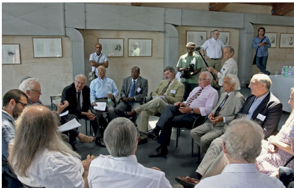
Při debatě v sekci o globálním oteplování.