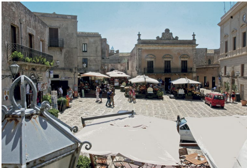
Hlavní náměstí v Erice.

vypadá jako absurdní stěžování si, ale pomalu se učíme chodit drobnými krůčky.