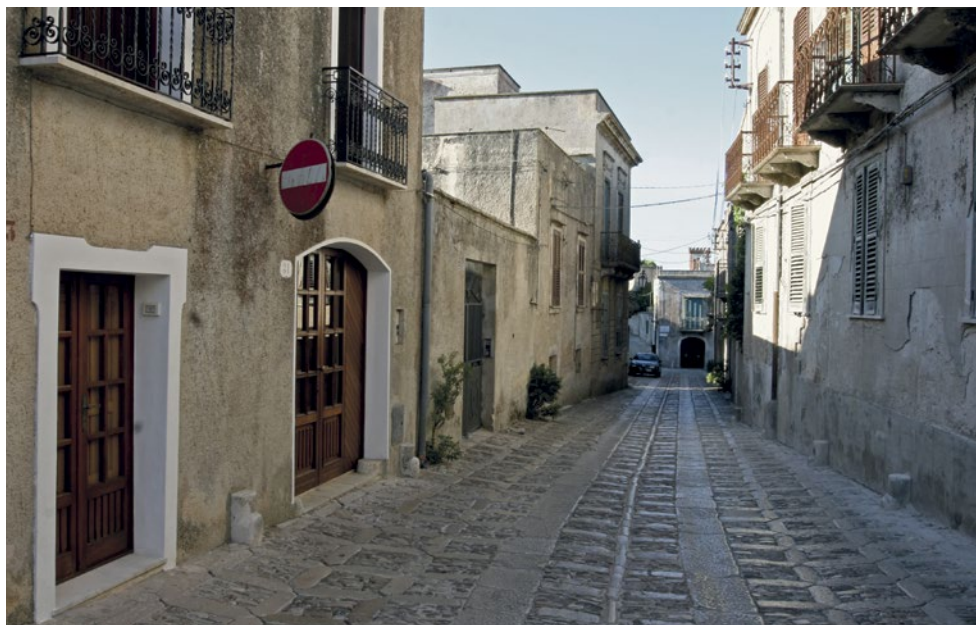
Úzké, klouzavé uličky města.

konference. Vypadá jako malá kaple. Městečko je v sobotu o půlnoci plné návštěvníků, lanovka v tento víkendový den jezdí do 4 hodin ráno. Jsme na Sicílii, o půlnoci jsou zde na ulicích malé dětičky předškolního věku.