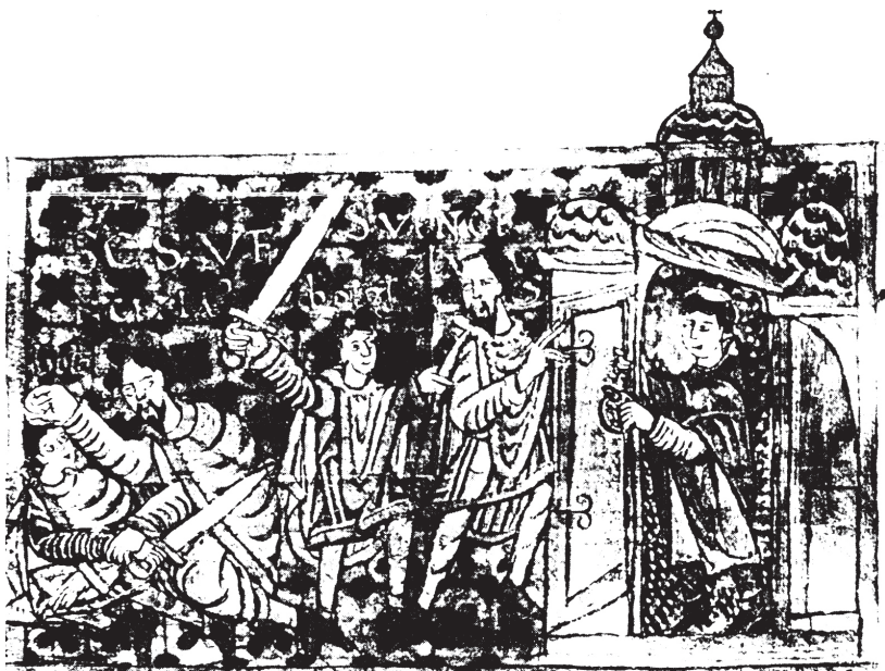
Nejstarší zobrazení vraždy sv. Václava z Gumpoldovy legendy (počátek 10. století)

badatele Václava Tatička, který někdejší Boleslavův hrad „odstěhoval“ přes řeku Labe na místo zámku v Brandýse a kostel sv. Kosmy a Damiána, u něhož mělo dojít k vraždě, prý stál na místě nynější kapličky sv. Rocha u Labe.