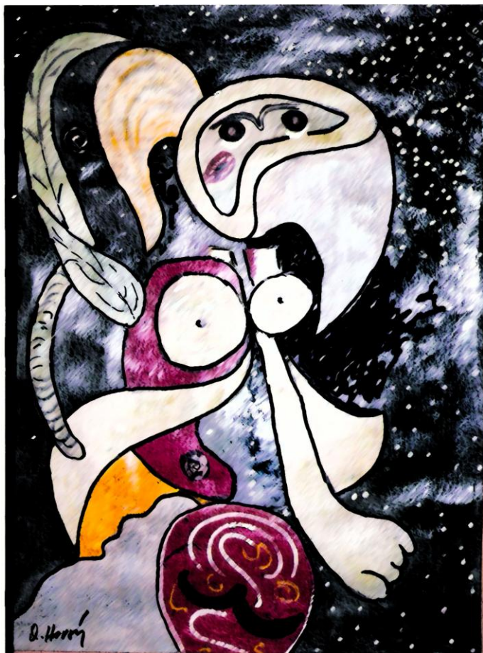
Moje manželka Olga, akvarel, 1972.