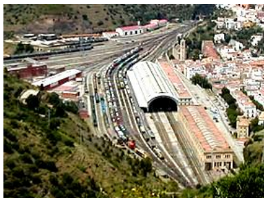
Železniční stanice v Port Bou, pro nás vstupní brána do Španělska

A jako každý den, abychom ušetřili za nocleh v hotelu, nočním rychlíkem pokračujeme do Port Bou. Je to již španělská hranice. Je sedm hodin ráno a nějací krásní mladí úředníci nás vytahují z vlaku a se vši důstojností žádají, abychom svá