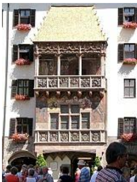
Innsbruck – Goldenes Dachl – Zlatá stříška

Schönbrunn. Unaveni z cesty vídeňskými ulicemi, odpočinek ve francouzském a anglickém parku v Schönbrunnu plný fontán, rybníčků a soch, stoupající až k vítězné bráně Glorietě, byl balzámem na tělo i duši. Putování po Vídni jsme zakončili návštěvou Prátru. Sedli jsme si na lavičku a povečeřeli sýr s houskou. Obrovské vídeňské kolo (u nás v těch dobách nazývané jako ruské kolo) na nás udělalo dojem. Svést se na něm a podívat se na Vídeň s výšky bylo ale nad náš finanční rozpočet.