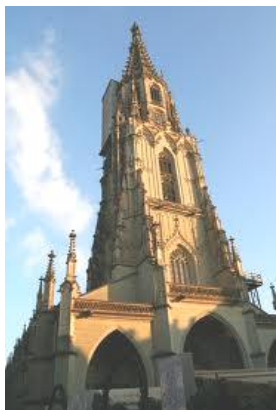
Sto metrů vysoká věž katedrály v Münsteru

Následující den dopoledne po snídání v hotelu National vidíme Bern jako z rychlíku. Orloj, parlament, několik nádherných šlechtických paláců, které na nás působily velmi útulně a přitažlivě. Mezi domy a řekou probleskovaly v dáli zasněžené hory Mönch a Jungfrau (4158,2 m nad mořem). Rychlostí blesku jsme navštívili slavnou pozdně gotickou katedrálu Münster, budovanou v letech 1421 až 1893. Její výstavba tedy trvala několik staletí. Z její věže