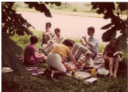
Svačině v trávě za městem

„Zlatá stříška“ s gotickým arkýřem císaře Maxmiliána se střechou pokrytou 2657 pozlacenými měděnými šindeli, Tyrolské zemské muzeum s nádhernými obrazy a goblény, kostel svatého Jakuba, park s průhledem na vysokou horskou stě-