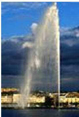
Vodotrysk na Ženevském jezeře byl uveden do provozu v roce 1951 a stříká až do výše 130 m.

„rudá“ jména zapsali do jakési knihy. Potom se na vše vyptávají, je to hotový křížový výsledek. Proč a kam jedeme, za jakým cílem, kdo nás poslal, jak tam budeme dlouho, kdo nám cestu financuje. Vždyť je to podivné, dva „rudí“ a tak mladí, to přece nemůže být normální. Kvůli nám se poněkud opozdil odjezd vlaku, ale to přece nebyla naše vina. Nakonec nás pustili a dva podezřelí mohli pokračovat v cestě do konečného cíle cesty, do Barcelony. Do tolik u nás proklínaného „fašistického Španělska“, do země diktátora generalísima Franka. Vlastně posledního generalísima, neboť ten náš komunistický generalismus Stalin již dávno zemřel.