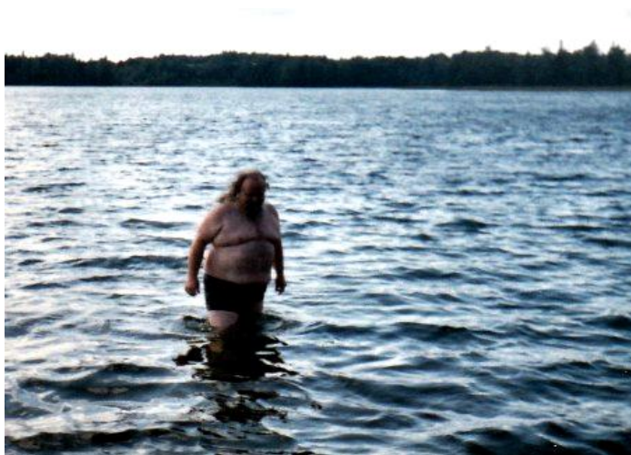
a pak velikost č. 5