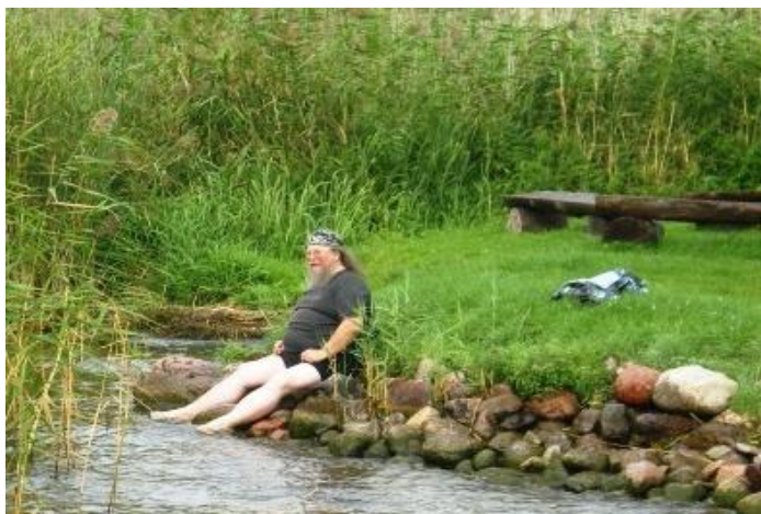
Napřed smočit nožky