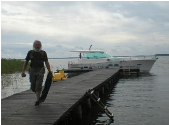
Milionář a jeho jachta