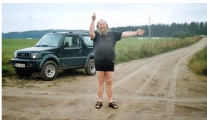
Čuňas řídí nejrušnější křižovatku v Polsku