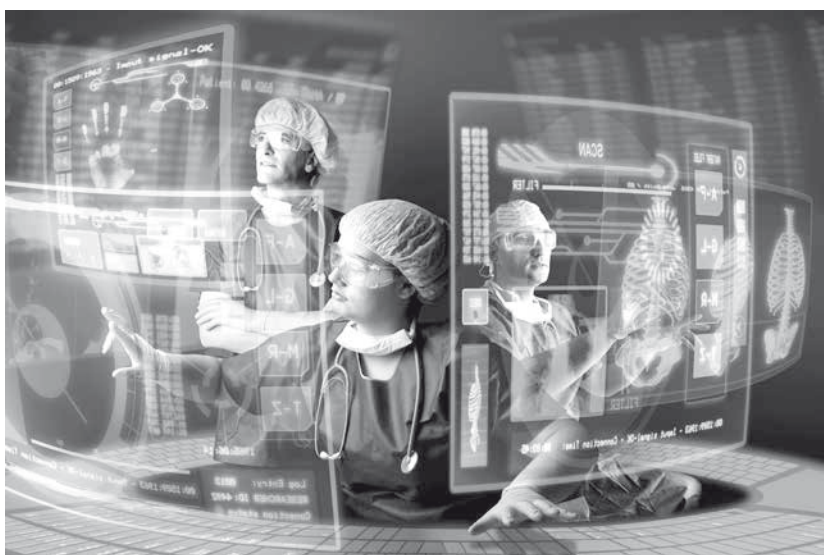
Obr. 1 Reklamní fotografie eHealth

Tato učebnice je primárně určena především studentům medicíny a lékařům, kteří se o nové obory eHealth a telemedicínu zajímají. Pojem eHealth se do zdravotnictví dostal na přelomu 20. a 21. století. Elektronizace zdravotnictví souvisí s rychlým rozvojem informačních a komunikačních technologií. Propojením výpočetní techniky s medicínou vznikl nový obor, který používá název eHealth. V době vydání této knihy lékařům a zdravotníkům u nás pod kůži moc nejde. Podíváte-li se na různé konference a odborná sympozia s uvedenou tematikou, jednoznačně vidíte převahu nadšených inženýrů nad doktory. Lékaři zapojení do elektronizovaného zdravotnictví zůstávají zatím hlavně na reklamních fotografiích (obr. 1).