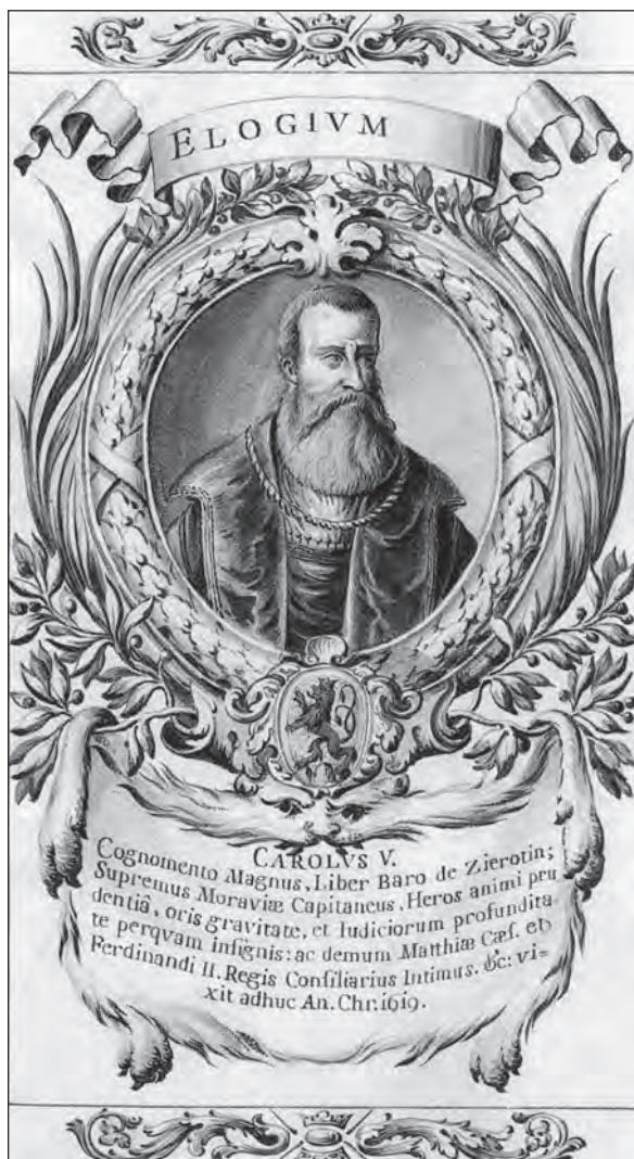
Karel starší ze Žerotína

odsudek německých knížat byl velmi blízký názorům nedávno zavražděného francouzského krále Jindřicha IV. Moravský šlechtic nevěřil v opravdovost přípravných akcí a kampaně kalvínsky orientovaného falckého dvora a jeho konspirátorů. O síle a diplomacii