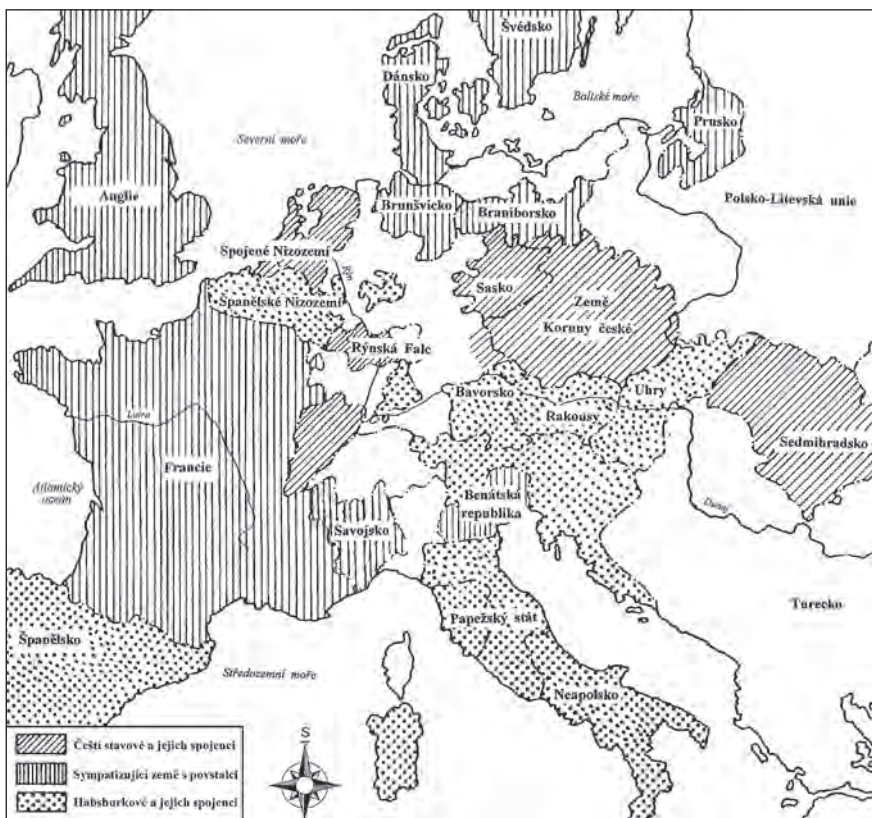
Evropské státy a mocenské tábory v předvečer třicetileté války

náboženské protivy v Čechách přiosřily díky habsburské protireformační ofenzivě. Různé poplašné zvěsti a provokace vyvolávaly paniku a obavy nejen u politických špiček, ale především u prostého nekatolického obyvatelstva, pobouřeně sledujícího činnost nenáviděných jezuitů. Česká otázka měla kontinuální sepětí s krizovými jevy v říšském prostředí, stejně tak jako s uherskými nepokoji.