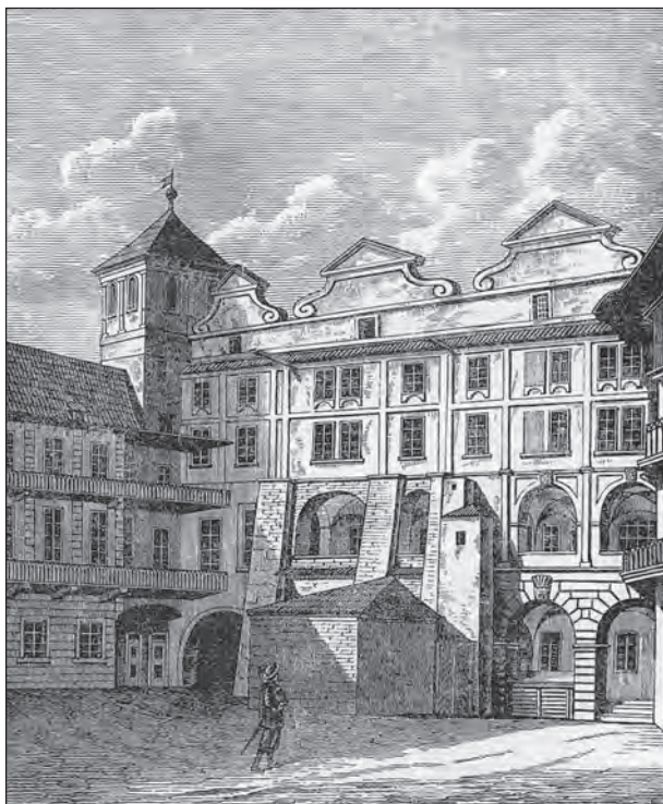
Palác pánů Smiřických ze Smiřic na Malostranském náměstí

Rozsudek smrti nad předními panovníkovými rádci a úředníky by znamenal otevřený ozbrojený zápas s vídeňskou vládou, a s tím také hlavní strůjci atentátu kalkulovali. Lze říci, že už cílevědomě připravovali povstání. Bylo rozhodnuto, že na Pražském hradě bude před stavovskou většinou zinscenován s úhlavními nepřáteli krátký soudní proces. Navržena byla i forma potrestání: vyhození rušitelů Majestátu z oken české kanceláře, aby nebyla na místě tak památném prolévána