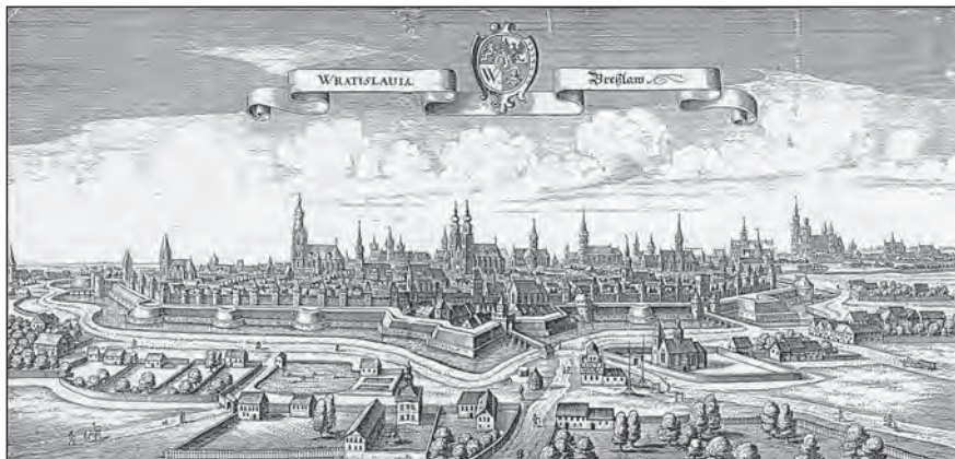
Vratislav, hlavní město Slezska

o bohatou protestantskou zemi, ležící mezi Braniborskem, Saskem a Polskem, s níž obě zneprátené strany a koalice musely počítat, a to buď jako s vážným protivníkem, nebo výhodným partnerem. Na základě dřívějších dohod bylo povinností Slezska, aby v tomto okamžiku odlehčilo české stavovské armádě na vzniklém jihočeském bojišti, ale slezská politická reprezentace toužila po větší míře samostatnosti a chtěla si celou záležitost více promyslet. Největší úlohu zde sehrával Jan Jiří, markrabě braniborský a slezský kníže krnovský, jenž jako první z tamních politiků pozvedl hlas ve prospěch české reformace a protihabsburského odboje. Ostatní knížata však váhala a nechtěla do otevřené války s Habsburky vstoupit.