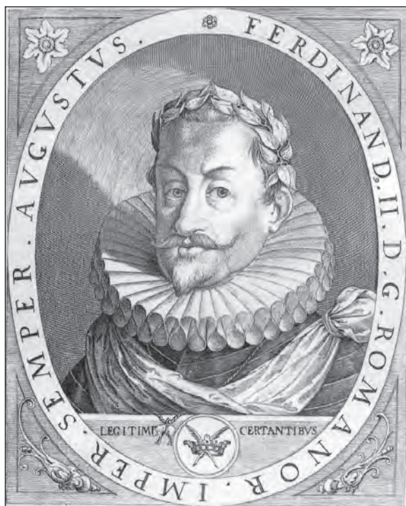
Císař Ferdinand II.

Na brněnském srpnovém sněmu musel Žerotín pochopit, že na sebe vzal nejnevěděčnější úlohu, kterou nikdy nemohl splnit. Jeho