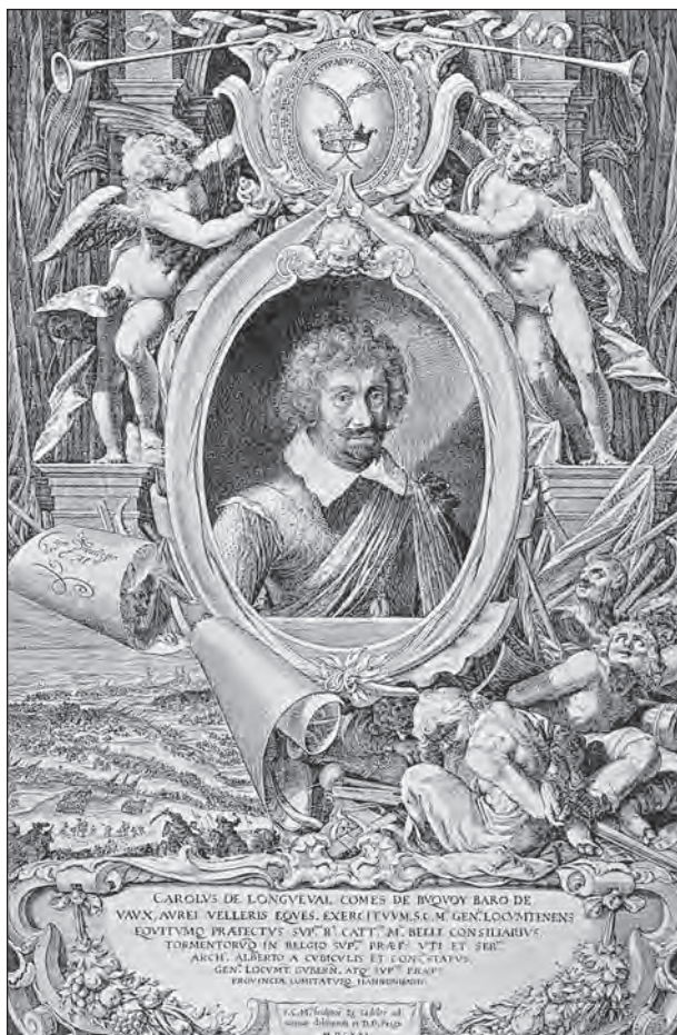
Karel Bonaventura hrabě Buquoy

snažil drobnými akcemi obsadit okolní cesty a důležitá místa, která stála na trasách do Bavorska a Rakouska. Nakonec se mu podařilo ovládnout Český Krumlov, odkud byla vypuzena císařská posádka, která měla kontrolovat tzv. „Zlatou stezku“.