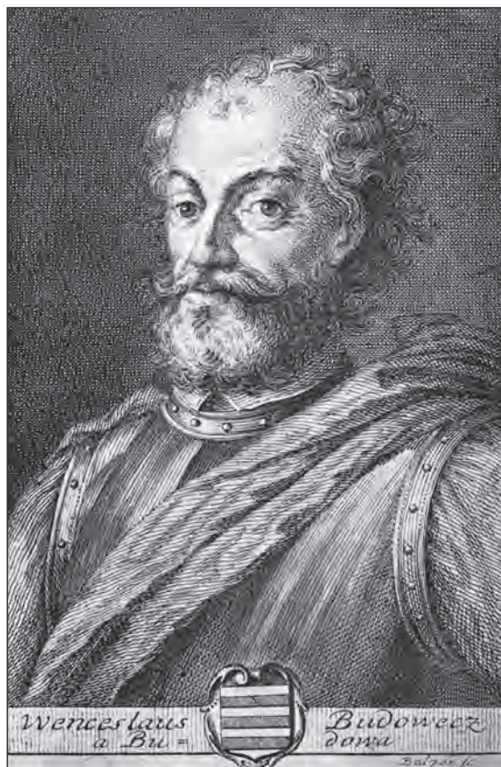
Václav Budovec z Budova

ze Žerotína, kterého v době českého stavovského povstání naopak vyzýval k obnovení této politické koncepce. I Budovec pochopil, že další cesta je možná jedině vyvoláním protihabsburského hnutí. Čili to, co za bojů o Majestát odmítl. Pro své morální vlastnosti, rozsáhlé vzdělání, životní zkušenosti a náboženskou snášenlivost se těšil úctě na všech