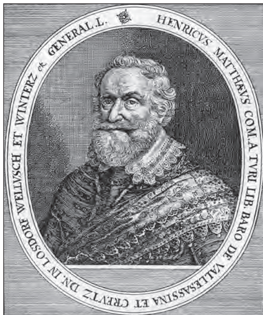
Jindřich Matyáš hrabě Thurn

Znalci těchto státovědných ran novověkých myšlenek jsou označováni jako monarchomachové. Právě oni patřili k hlavním ideologům českého stavovského povstání.