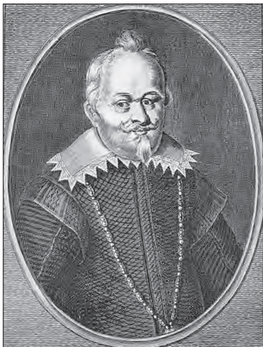
Vilém Slavata z Chlumu a Košumberka

vynesen rozsudek nad Slavatou a Martinicem. Shromáždění to přijali s bouřlivým souhlasem. Jen hrstka zainteresovaných předáků věděla, kam naplánovaná akce spěje.