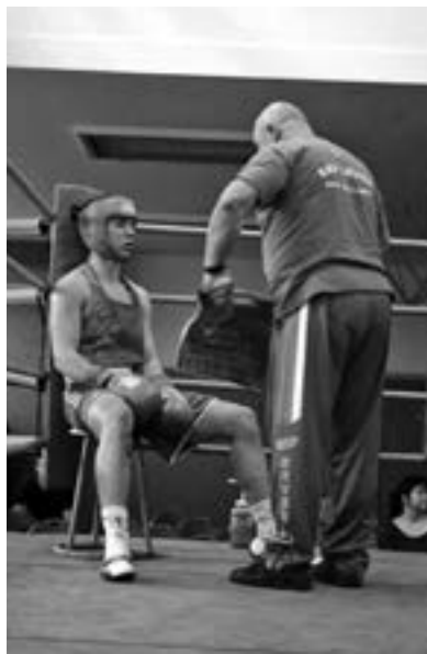
Boxer v rohu s trenérem, MČR juniorů 2016

Jak už jsem se zmínil, box je tvrdý sport, který je nejen náročný na fyzickou kondici, ale navíc bolí. Někde jsem četl diskusi, kdy se mladý potenciální boxer ptal, jestli box bolí. Odpověď byla prostá – ano, box