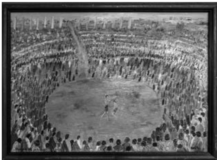
ANTIKA, R. Osička, olej na plátně

Box patří k nejstarším sportům vůbec, což málokdo ví. Vůbec první, a po dlouhou dobu vůbec nejmocnější, zbraní člověka byla pěst. První organizované boxerské utkání bylo zařazeno na I. olympijských hrách v roce 776 před n. l. Ovšem na prvních šampionátech se box objevil již daleko dříve. Prvním pěstním šampionem se stal Onomastos ze Smyrna v roce 688 před n. l. Ten byl později pověřen, aby sestavil jakási první pravidla pro olympijské zápasy v pěstním boji nazývané pygmé , kdy poražený mnohdy zaplatil svou prohru životem. Nejslavnější postavu olympijských pěstních zápasů však představuje Theagen z Thaosu, několikanásobný olympijský vítěz, hájící čest své obce a svůj život pěstmi ovázanými řemínky z volského řemení pobitého ocelí. S úpadkem Říše římské však zájem o pěstní zápas klesal a posléze jej předváděli jen otroci.