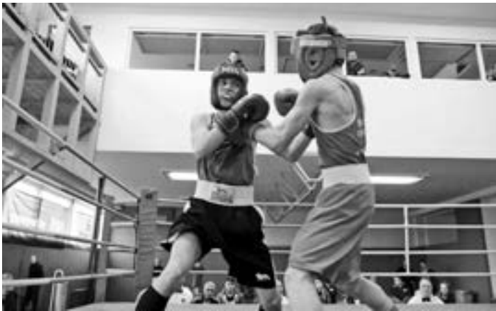
Zápas MČR juniorů 2016

Box patří mezi individuální úpolové sporty, dynamicko-silové s vysokou koordinační náročností. Starší název pro box zní rohování. Jiná klasifikace ho řadí mezi sporty heuristické. Často je popisován jako pěstní souboj dvou soupeřů (šerm rukou) zhruba stejného věku a stejné váhy. Cílem sportovního výkonu je zvítězit nad soupeřem pomocí úderů, úhybů a krytů povolenými pravidly AIBA.