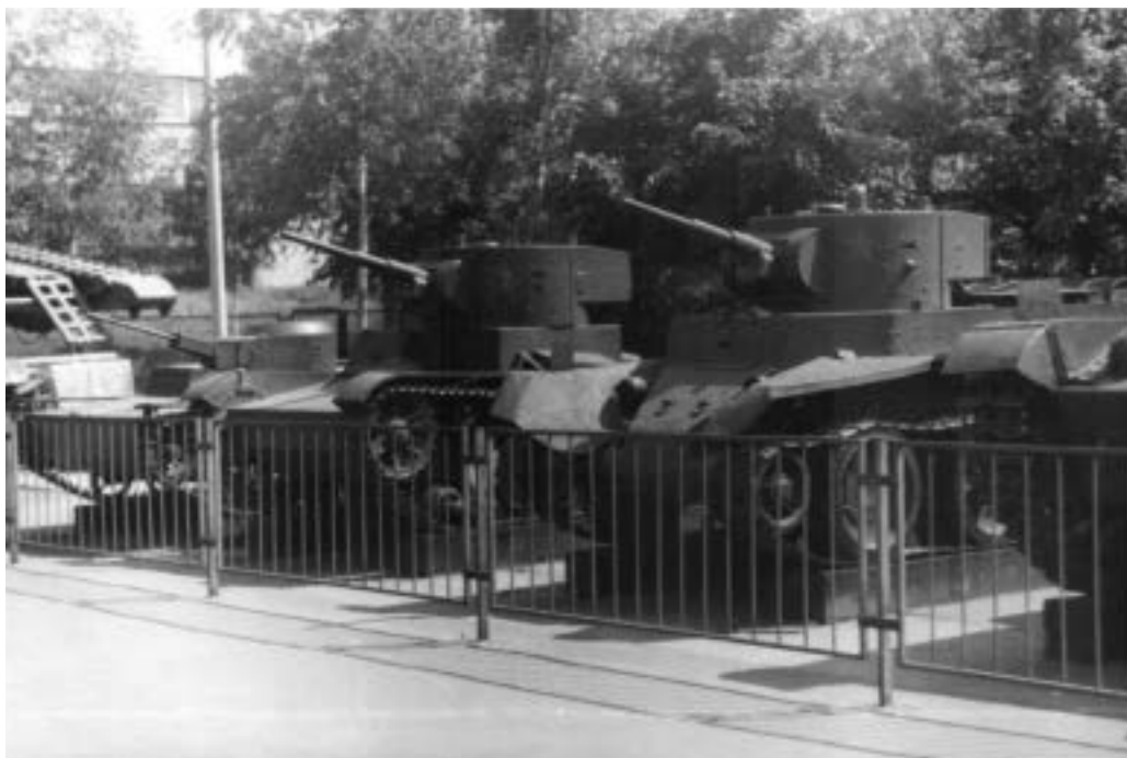
S tisíci tanků typů (zleva) T-38, T-26 a BT-5 šla Rudá armáda v červnu 1941 do války.

Úkol zpracovat historii sovětského tankového impéria je pro českého autora při nemožnosti studia v ruských archívech dosti troufalý, ale jeho dlouholeté sledování tohoto tématu při využití desítek knih a stovek časopisů, jakož i dávné rodinné ruské geny, snad umožní vyrovnat se s ním poctivě a pro zvědavé čtenáře zajímavě.