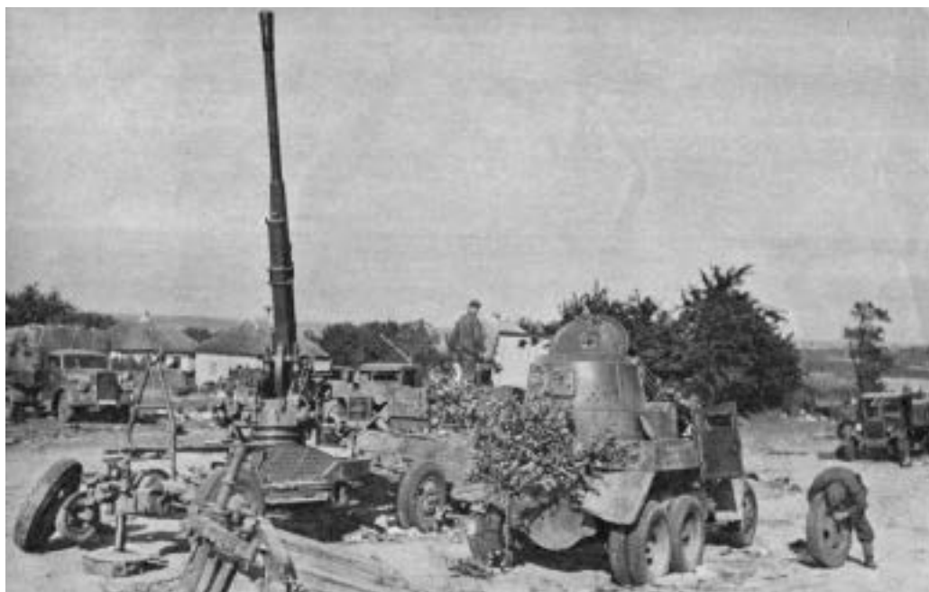
Rok 1941, opuštěná technika Rudé armády, vpravo obrněné auto BA-10

Třicátá léta se již nesla ve znamení bouřlivého rozvoje Rudé armády, zvláště jejich tankových a mechanizovaných vojsk, určených k hloubkovým útočným operacím za hromadného nasazení tisíců tanků a obrněných automobilů. Rok co rok vyjždělo z továren zhruba tři tisíce tanků všech kategorií, přičemž jako vzory pro jejich výrobu posloužily nejmodernější typy britského a amerického původu. Někdejší tankové velmoci, Velká Británie a Francie, začaly rozvíjet své tankové síly se značným zpožděním a v daleko menší intenzitě až od poloviny