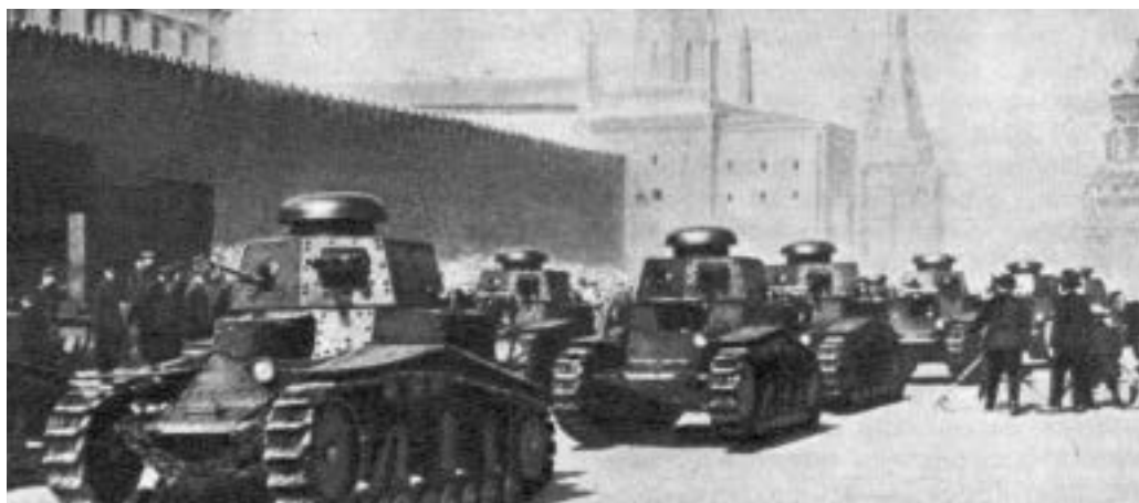
Tanky T-18 defilovaly na přehlídkách až do 30. let

1930 došlo k jistému vylepšení tanku T-18, když byl zvýšen výkon na 40 ks (29,4 kW), což zvedlo rychlost na 17,5 km/hod. Delší hlaveň kanonu přinesla prodloužení dostřelu, montoval se nový kulomet ráže 7,62 mm DT vz. 28 a dotace munice činila 104 + 2016 ran, to vše za cenu mírného zvýšení bojové hmotnosti o 380 kg.