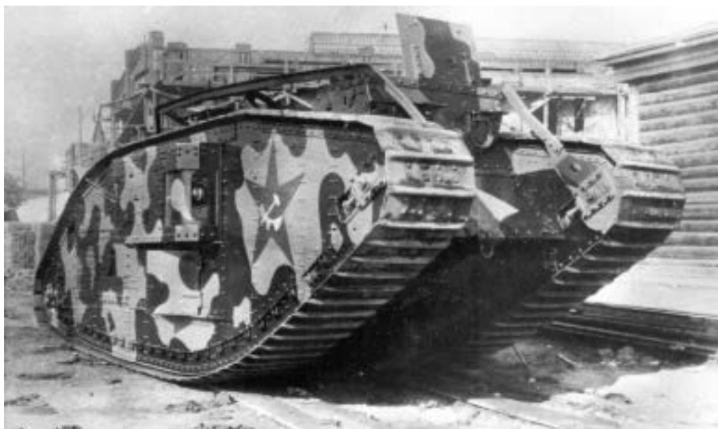
Tank Mk. V již jako „Rikardo“ v rukách Rudé armády

Kuriózní byl osud desítky Renaultů FT dovezených z USA v březnu 1920 do Vladivostoku, odkud je ukryté v uzavřených vagonch železničáři propašovali do Blagověščenska k rudým partyzánům. V červnu z nich byl postaven 1. Amurský těžký tankový divizion, který se pak až do konce roku 1921 účastnil několika akcí proti „bílým“ vojskům, přičemž osm vozů bylo v prosinci posláno na západ Ruska k opravě a poslední pojízdný 11. února 1922 zničili „bílé“ dělostřelbou z obrněného vlaku.