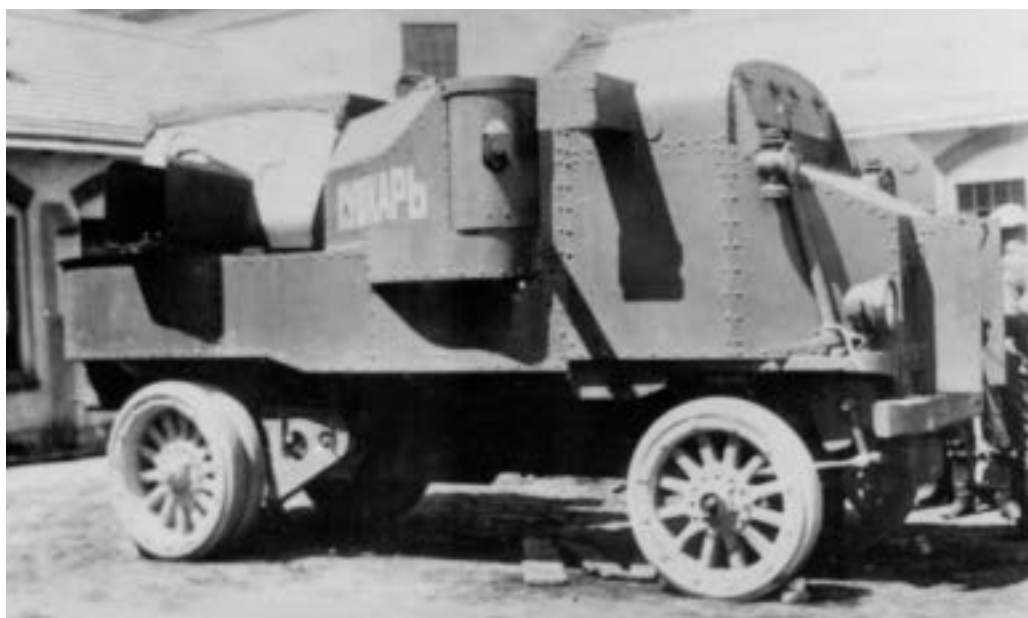
Těžký obrněný automobil Garford měl silnou výzbroj – tři kulomety a děla ráže 76,2 mm.

Tanky se jako zbrojní novinka objevily v polovině 1. světové války v britské a francouzské armádě, o něco později i v německé, zatímco ruská armáda touto technikou nedisponovala. Na druhé straně se v ruské armádě v letech 1914–1918 rozšířily v míře jinde nevídané obrněné automobily, převážně opancéřované a vyzbrojené v Rusku s využitím osobních či nákladních automobilů dovezených z Anglie, Itálie nebo USA. Občanská válka, která po