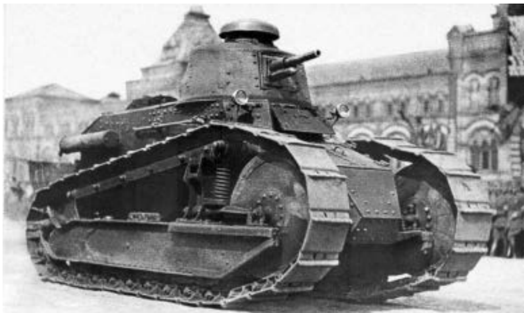
Lehký tank Renault s 37mm kanonem Hotchkiss při přehlídce na Rudém náměstí v roce 1928

Novgorodu jako vzor pro výrobu série tanků, kterou měla realizovat osvědčená Sormovská loděnice na řece Volze.