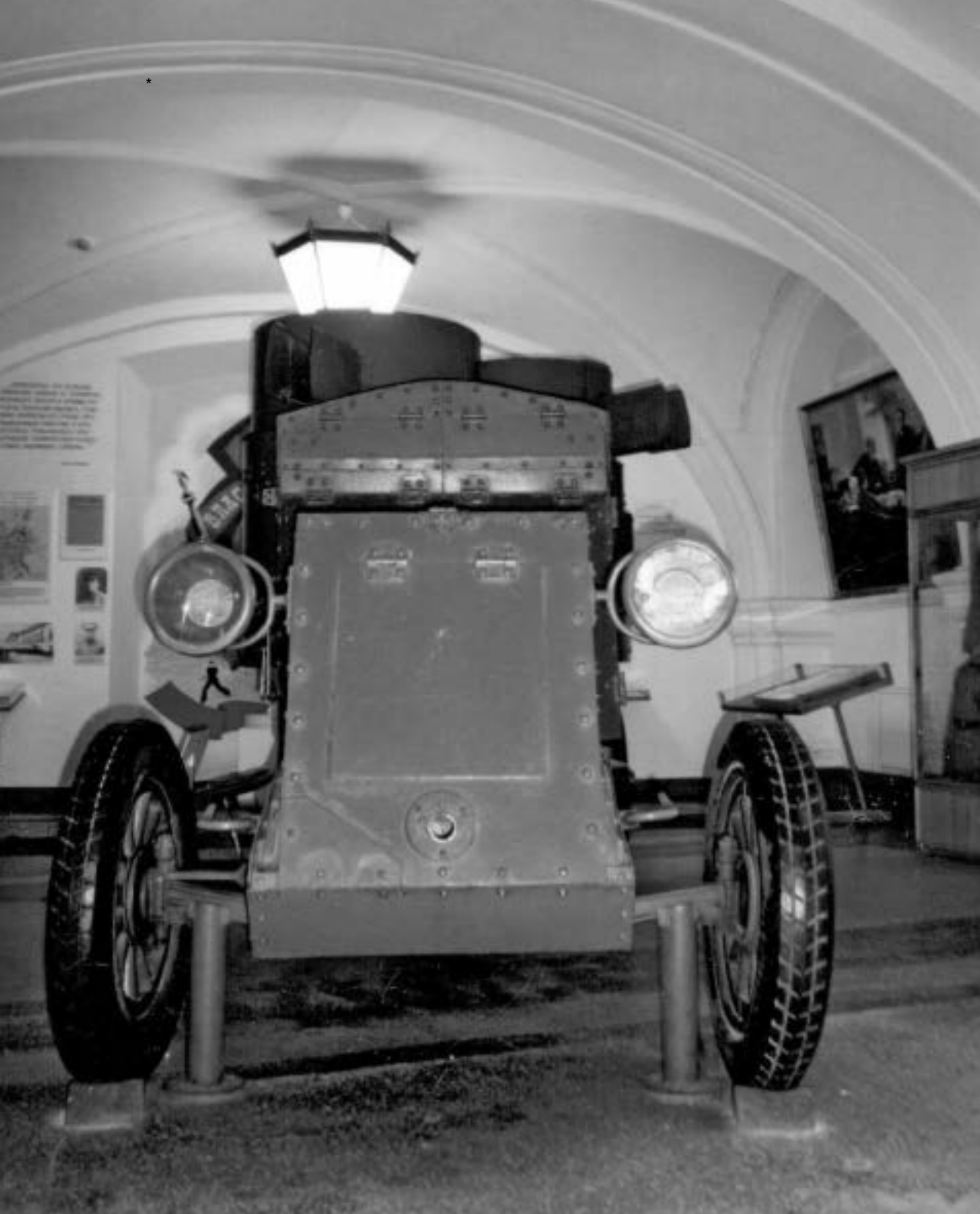
Jediný zachovaný „Leninův“ obrněný automobil Austin-Putilov