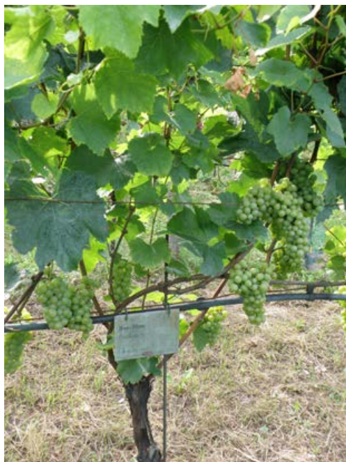
Obr. 1.3 Baco blanc – keř