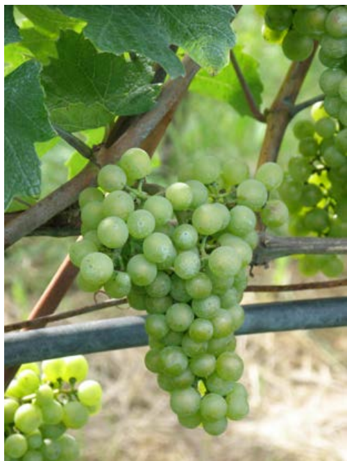
Obr. 1.2 Baco blanc – hrozen

I přes některé své negativní vlastnosti byly tyto odrůdy první, které se začaly po révokazové kalamitě a invazi houbových chorob rozšiřovat v Evropě.