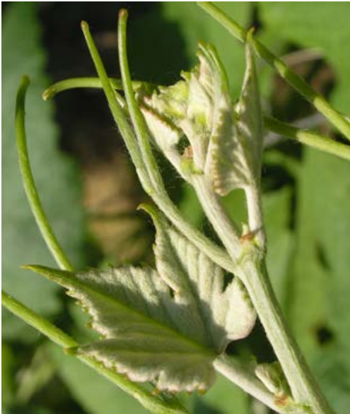
Obr. 1.8 Polouzavřený tvar vrcholu letorostu

Jedním z rozhodujících morfologických znaků při rozhodování o příslušnosti odrůd k druhu Vitis vinifera L. je tvar vrcholku letorostu. Odrůdy Vitis vinifera L. mají vrchol letorostu otevřený a zřetelně odlišný od ostatních Vitis spp. Odrůdy se zvýšenou odolností k houbovým patogenům a otevřeným vrcholkem letorostu byly jednoznačně zařazené do druhu Vitis vinifera L. – réva vinná.