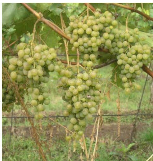
Obr. 1.4 Villard blanc – hrozny

Bílá moštová odrůda Villard blanc , známá také pod synonymem Seyve-Villard 12 375 nebo zkratkou SV 12 375, je výsledkem práce francouzské šlechtitelské firmy Seyve-Villard. Pochází z křížení Seibel 6468 × Seibel 6905 se zastoupením následujících druhů: Labrusca-Rupestris-Aestivalis-Cinerea-Berlandieri-Vinifera . List je středně velký, tmavozelený, lesklý. Hrozen je středně velký, kuželovitý, s řidším uspořádáním bobulí a rozvětvenou třapinou. Bobule je malá, oválná, zlatavá. Odrůda má bujný růst a vysokou násadu hroznů, které dozrávají v polovině října. Villard blanc má velmi dobrou odolnost k plísni révy a padlí révy. Víno je jemně aromatické, kyselina vyšší, travnatá.