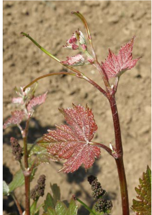
Obr. 1.9 Otevřený tvar vrcholu letorostu

PIWI odrůdy jsou odrůdy révy vinné, které disponují určitým stupněm odolnosti proti hou-