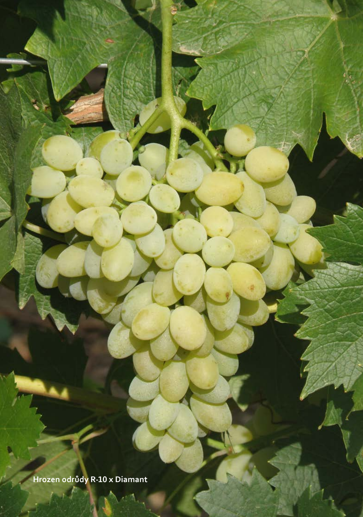
Hrozen odrůdy R-10 x Diamant