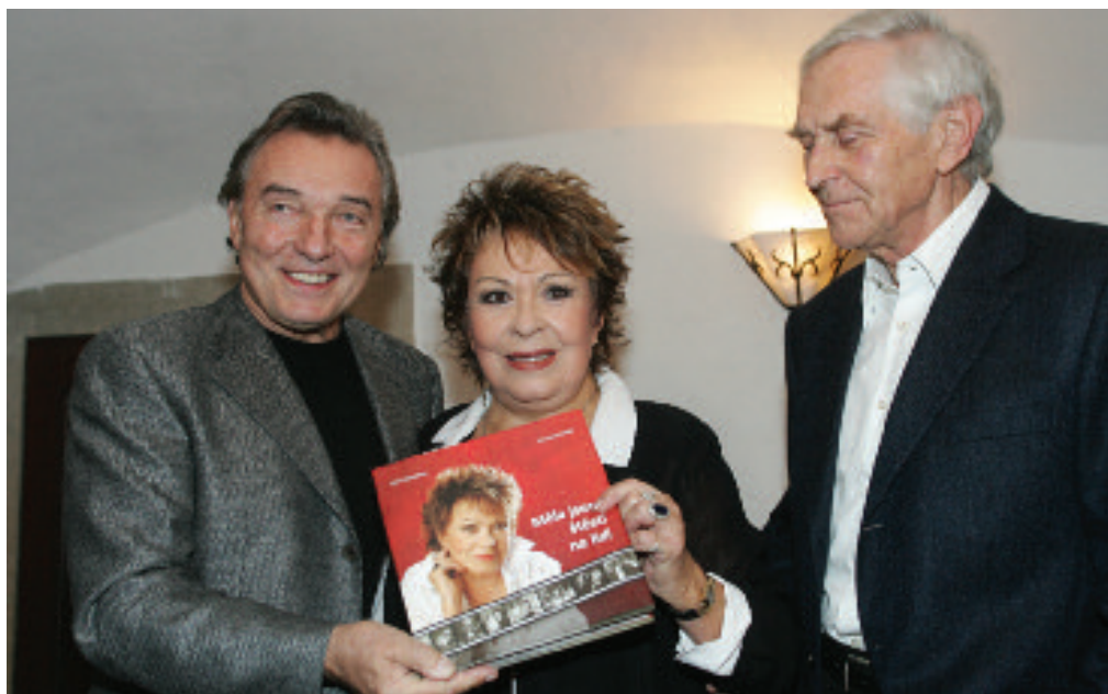
Na křtu memoárů Jiřiny Bohdalové, dalším mužem na snímku je známý dramatik Jiří Hubač.