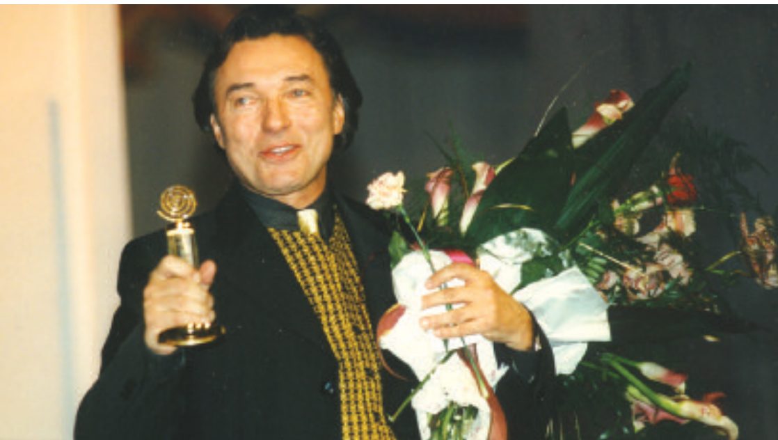
Zlatých slavíků má Karel Gott plnou voliéru. Od prvopočátku mu lemují celou jeho závatnou kariéru.