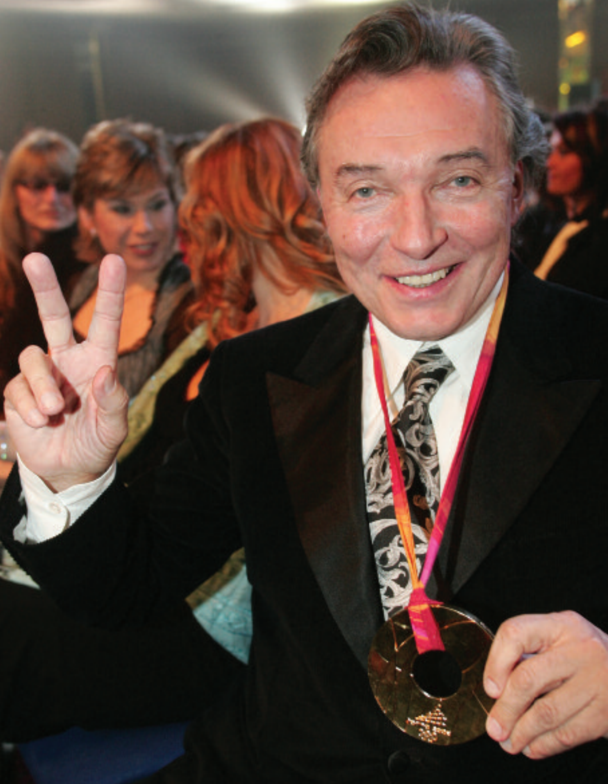
Jedna z aktuálních fotografií Karla Gotta, která byla pořízena na kteréisi společenské mega-akci...