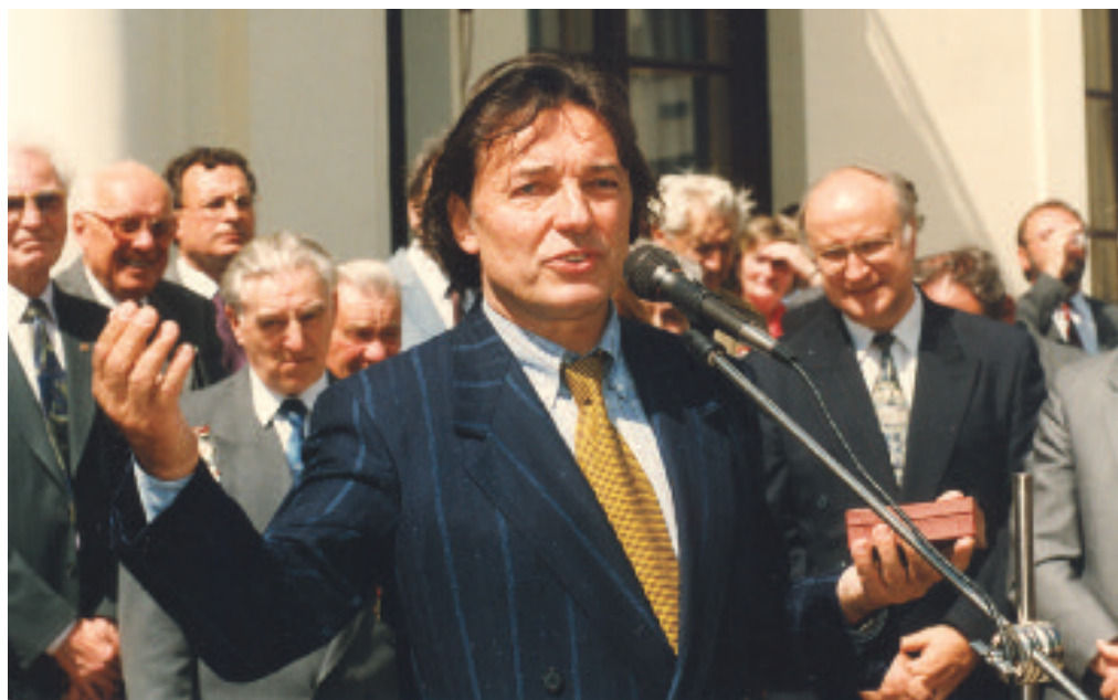
Poněkud „rozevlátá“ fotografie Karla Gotta, který je nejen skvělý zpěvák, ale rovněž i dobrý bavič.