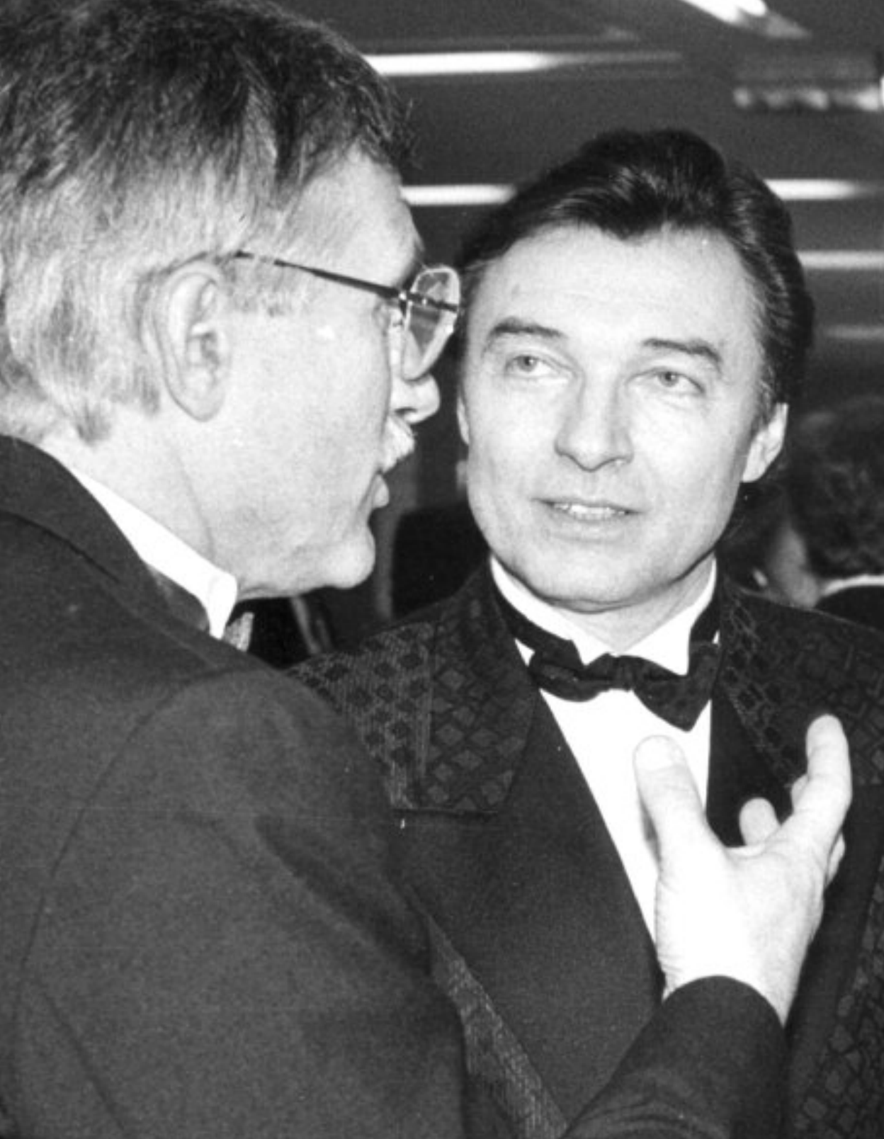
Další historický snímek – Karel Gott právě naslouchá Václavu Klausovi, který byl tehdy ministrem financí.