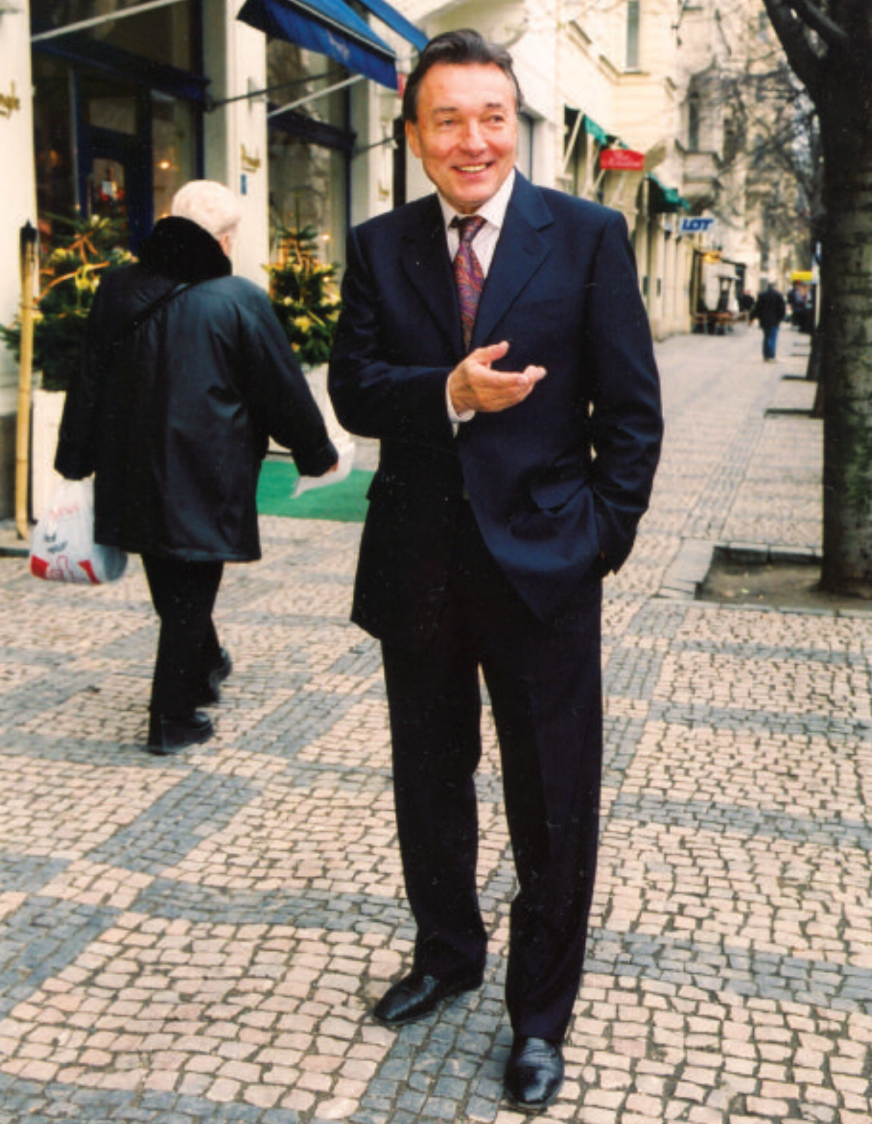
Momentka, která by se dala označit popiskem: Karel Gott „na václavským václaváku“.