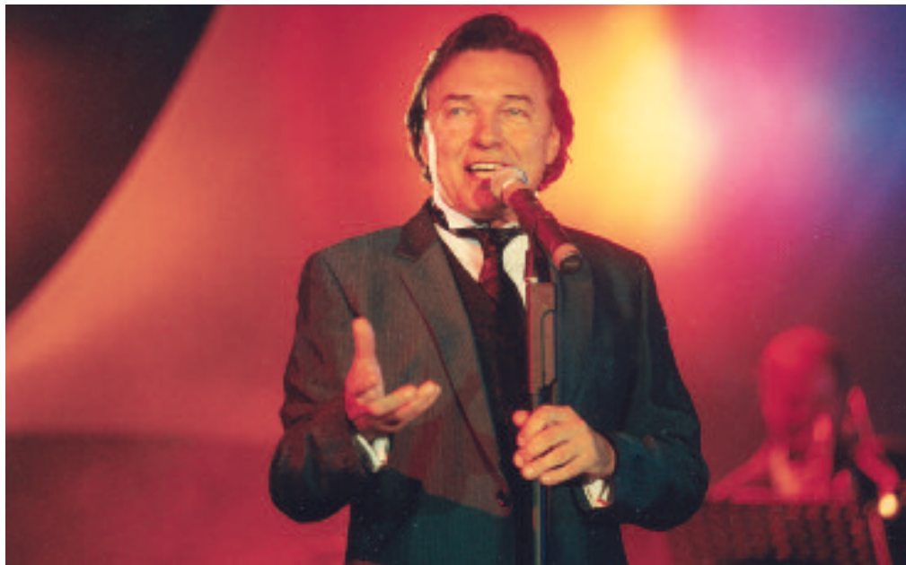
Stále elegantní, zábavný a charismatický. Jeho vystoupení mají vždycky úroveň, jiskru a švih.