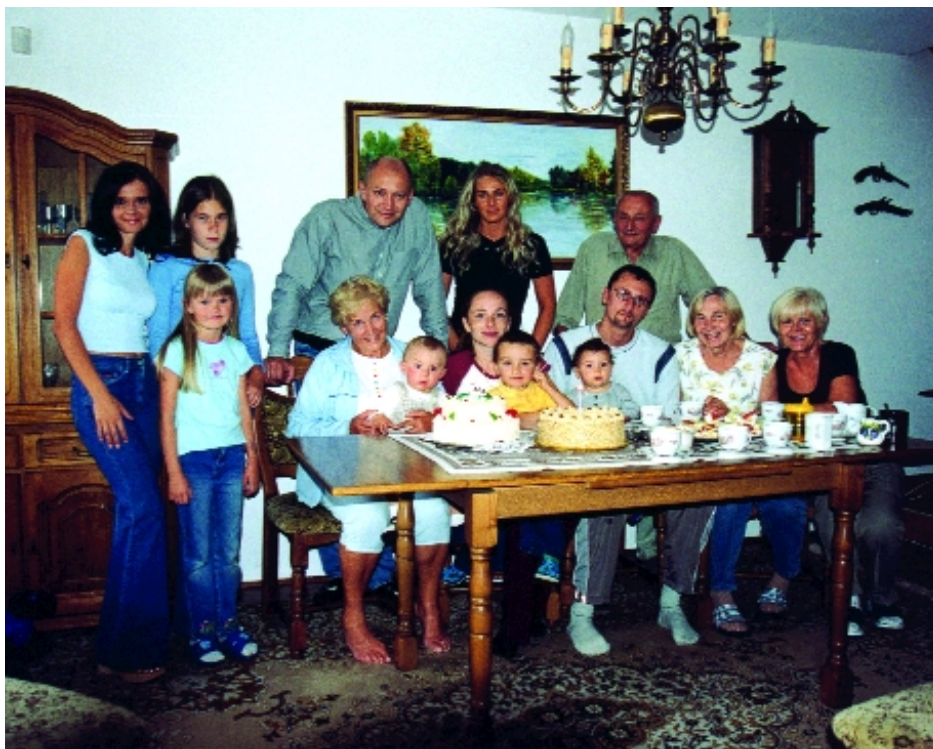
S rodinou pohromadě při oslavě prvních narozenin našeho synka