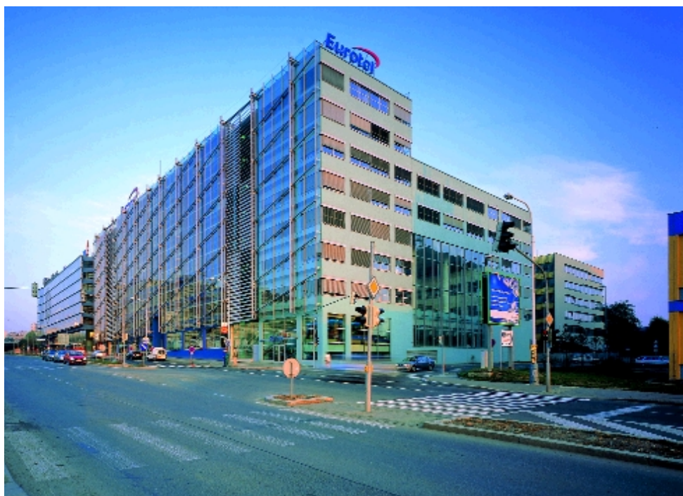
Dokončená budova A pro společnost Eurotel