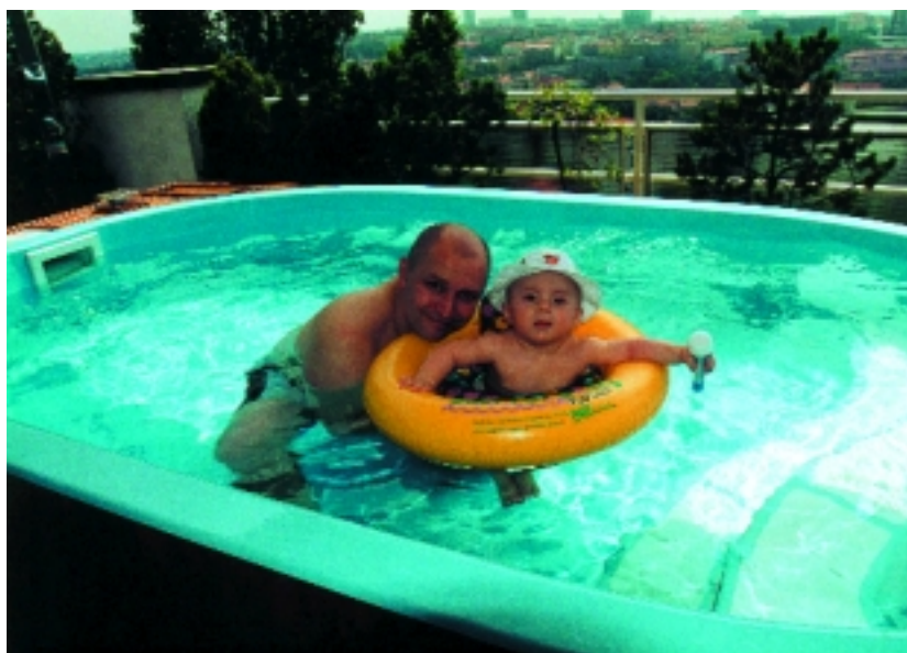
Pátek, 21. června 2002, den plný pohody