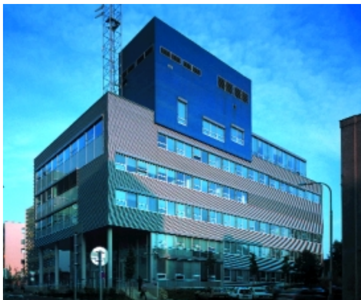
Pro Eurotel jsme postavili i menší budovu D.