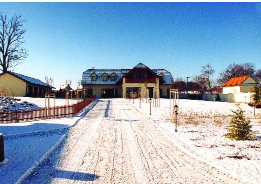
Areál na Sedlčansku byl dokončen.