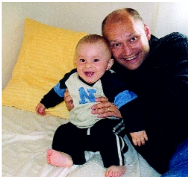
Vždy bylo dostatek důvodů k úsměvu.