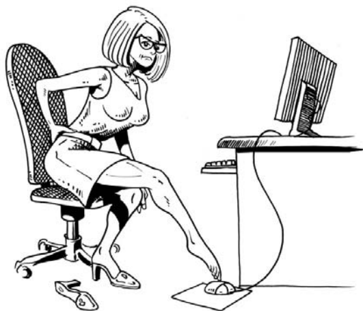
Obr. 2: Mýtus první: Pacient trpící bolestí zad musí být vždy práce neschopen

Bolesti zad mající svůj původ v poruchách funkce páteře jsou celosvětově považovány za jeden z nejzávažnějších medicínských, ekonomických a sociálních problémů. S tímto typem bolesti se během svého života setká téměř 85 % veškeré populace. Podle údajů ze Spojených států amerických bolesti zad bezkonkurenčně vedou v pořadí příčin pracovní neschopnosti osob mladších 45 let, zaujímají druhé místo v hodnocení příčin návštěvy lékaře, jsou pátým nejčastějším důvodem hospitalizace a čtvrtou nejčastější příčinou chirurgických zákroků. Roční náklady na léčbu a pracovní ne-