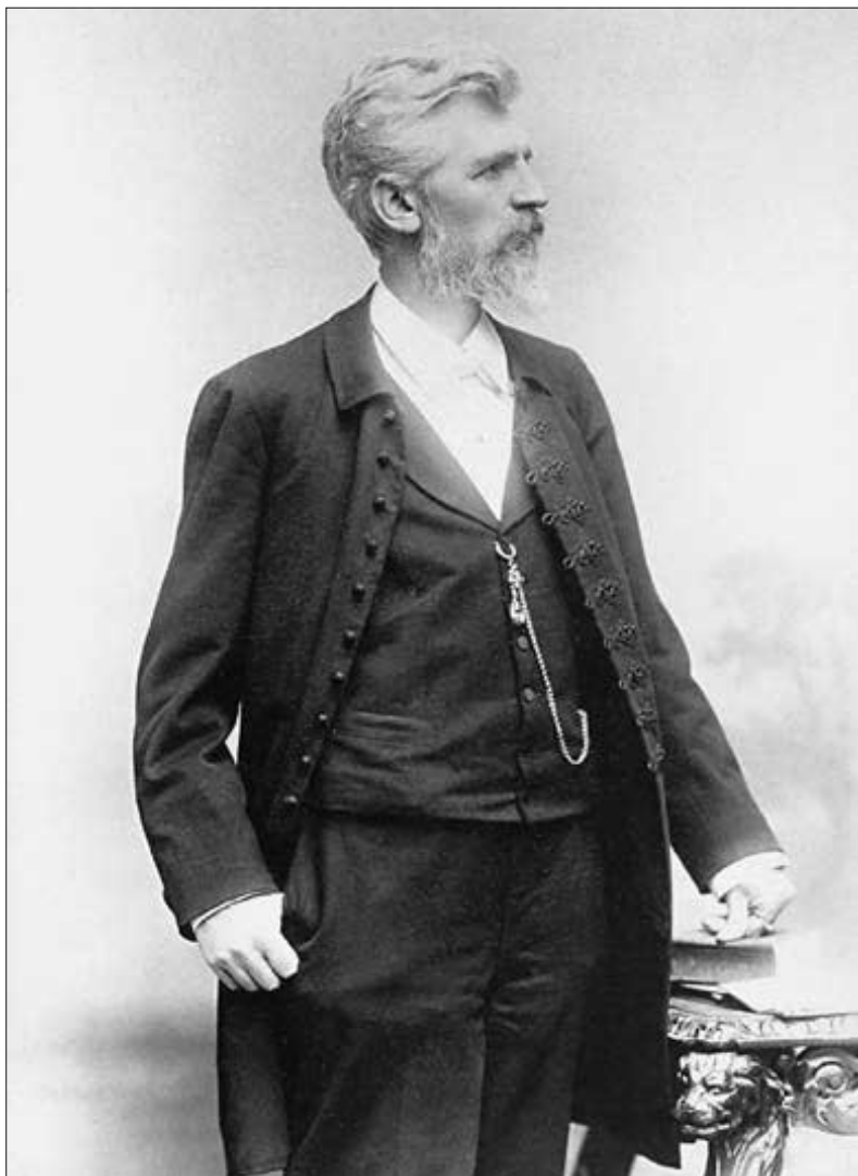
Místo výnosné soukromé praxi věnoval se z lásky k rodnému městu čestným pracím na radnici... (str. 39)