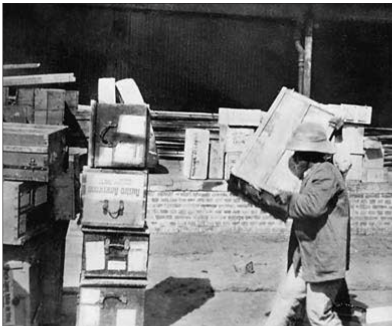
Moje zavazadla byla v říčním i přímořském přístavu hlavního města Argentiny dobře známá. (str. 29)

Zbývala mi jediná možnost: Odvézt Čerwuiše zpět do Pacha- ka oklikou přes Evropu.