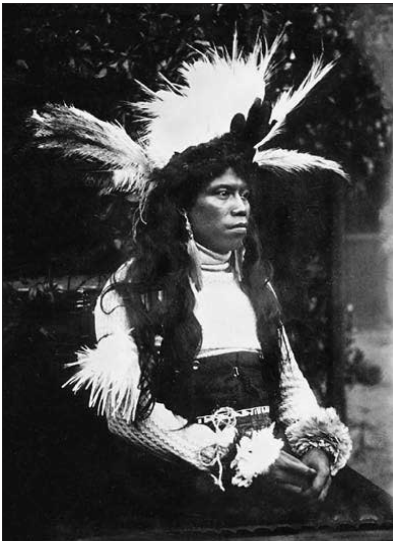
Bylo to na pováženou, nechat se provázet do tak vznešené společnosti divochem... (str. 34)