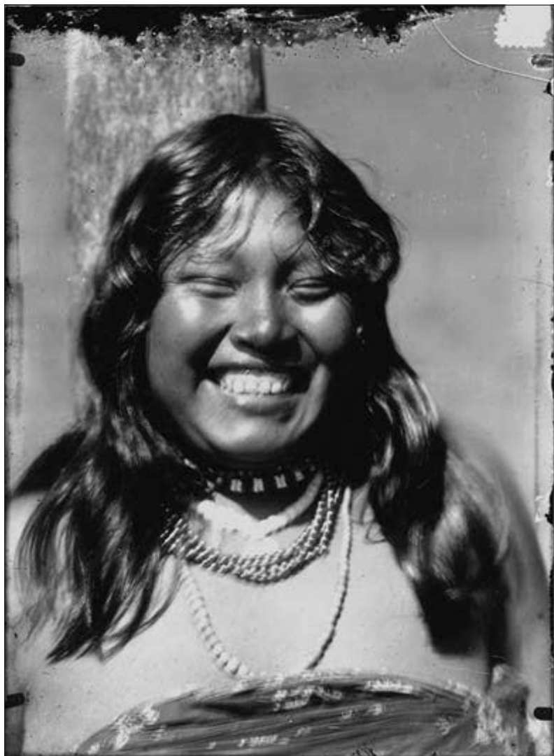
Krásná Tugle (str. 31)