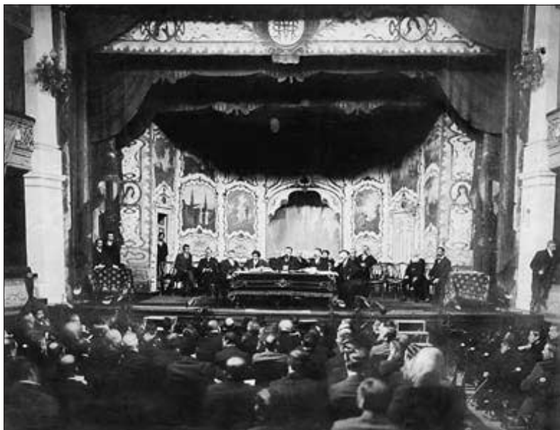
...zasedání kongresu amerikanistů... (str. 34)

Jinou vzpomínku na domov v něm vyvolal zlatý řetěz vídeňského starosty Luegera, který poctil kongres svou návštěvou. Byl známý škodolibým vtípkováním na účet druhých a vždycky se našlo mnoho servilních posluchačů. Při pohledu na Čerwuiše zavětlil vhodnou příležitost, ale tentokrát to dopadlo naopak. Čerwuišovi se zalíbil jeho řetěz - také u nich se lovci zdobí trofejemi - ale nechápal jeho význam. Kdyby to byly zuby jaguára, bylo by jasné, že jsou výrazem jeho udatnosti - ale kamení? Vysvětlil jsem mu, že je to odznak náčelníka zdejšího kmene Prátrů. Čerwuiš byl rád, že narazil na kolegu vladaře, ale protože se od něj nemohl dočkat dárku, přistoupil k němu sám a než se kdo nadál, sundal zděšenému starostovi zlatý řetěz a pověsil si ho na krk. Nelíbilo se mu sice, jak je těžký, ale vyzval mě, abych přeložil, že se ho přesto uvoluje nosit.