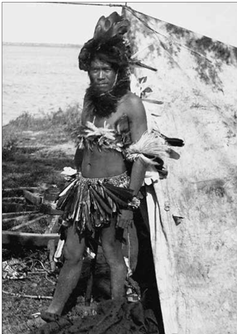
Už před východem slunce stál u mého stanu. (str. 23)