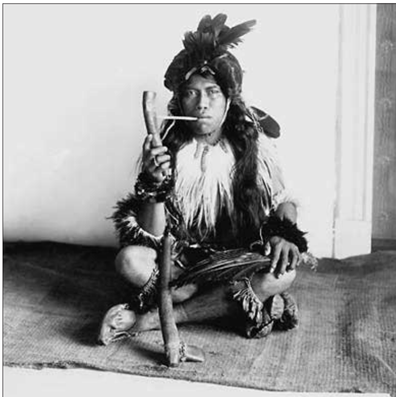
...usadil se na pokrývce... (str. 44)

naší vyspělosti? A co na to jeho krajani? To byly otázky, které jsem si zase a znovu pokládal.