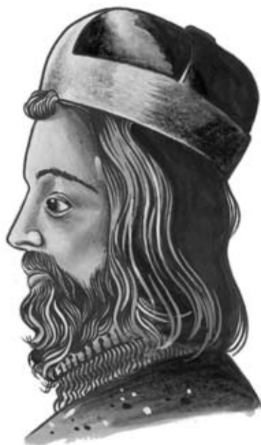
Kníže Václav I.

Budoucí kníže Václav přišel na svět* zřejmě ve Stochově nedaleko dn. Kladna (i když v literatuře najdeme také tvrzení, že k tomu došlo v Boleslavi).