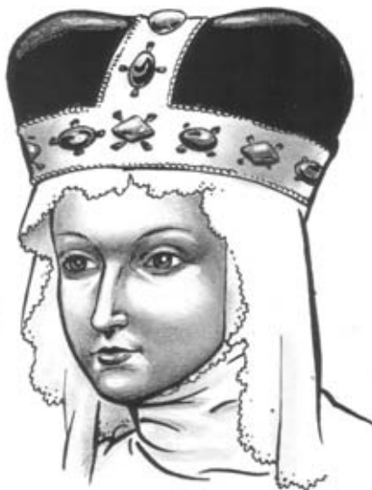
Ludmila, manželka knížete Bořivoje

Manželům se kromě dcer (zřejmě většinou zemřely v kojeneckém věku) narodili dva synové, kteří usedli na knížecí stolec.