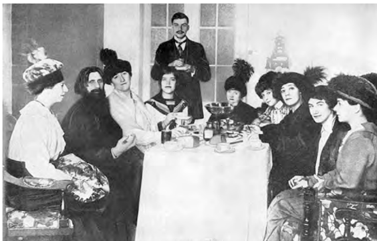
Němcům dodával informace údajně Grigorij Rasputin, pologramotný zázračný léčitel ze Sibiře, který se vetřel do přízně carovy rodiny (na fotografii druhý zleva).

pozice se vypracoval z místa písaře na petrohradském magistrátu a potom reportéra bulvárních novin pomocí burzovních spekulací.