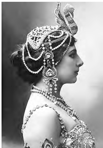
Nejznámější vyzvědačkou první světové války byla bezesporu tanečnice a kurtizána Mata Hari-„H-21“.