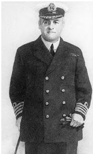
Zakladatel britské výzvědné služby Mansfield Cumming

V roce 1910 vláda obě sekce oddělila: Kelleho Tajnou službu (Security Service) podřídila ministerstvu vnitra a Cummingovu Tajnou zpravodajskou službu SIS či také MI 1c ministerstvu zahraničí. Práci