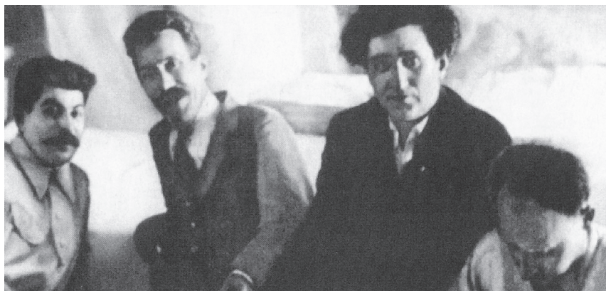
Stalin s Rykovem, Zinověvem a Bucharinem

Celý rok 1927 byl v tomto smyslu vyplněn morálním rozkladem leninských bolševických vůdců. Kolísali mezi „věrností“ straně, což stále jednoznačněji znamenalo Stalinovi, a svými pofiderními zásadami, které vystrkovali na střídající se prapory. Bylo těžké říci, že jim jde o podíl na moci. V podstatě se rozdělili a asi osm až deset tisíc svých přívrženců, ponejvíce z vyšších intelektuálních složek, nechali na holičkách. Větší část kolem Zinověva a Kameněva vsadila na dohodu se Stalinem, tvářila se disciplinovaně a vnucovala se k opětnému přijetí do stranické špičky. Zdá se, že to Stalinovi nebylo sympatické, nestál o ně, ale fakt jejich morální porážky vnímal pozitivně. Podřídít se nehodlal Trockij, jeho svěřenci však táli jak jarní sníh a brzy se počítali jen na