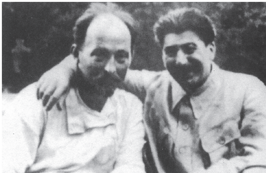
Stalin s Dzeržinským, prvním sovětským čekistou

přednost (ve srovnání se svými potenciálními soupeři, jimž se ve skutečnosti nemohl rovnat) a usiloval o jednoduchá hesla, hýřil tolerantností, kterou odložil až po svém dokonalém vítězství.