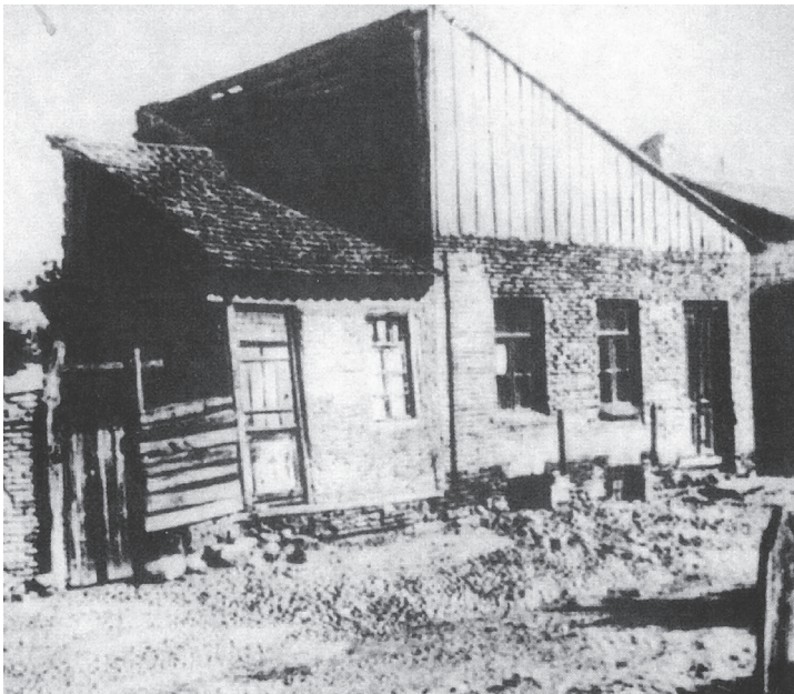
Stalinův rodný dům

Zdá se, že Stalinovými přirozenými vlastnostmi byly lež a utajování. Nic podrobného ani přesného o jeho životě, než vstoupil do popředí veřejného zájmu, nevíme, sám neprozradil skoro nic, pokud se ale o něčem zmínil, nejčastěji si protiřekl. Tak například datum jeho narození. Dnes s jistotou víme, že se narodil 18. prosince 1878 (používám důsledně