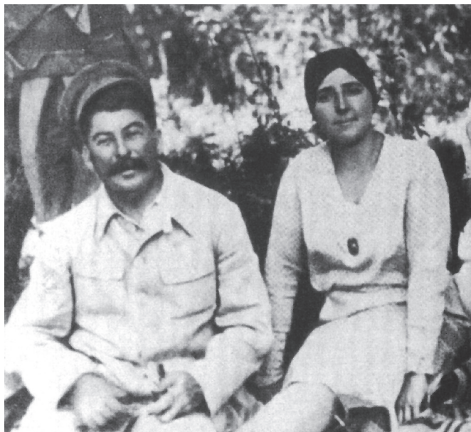
Stalin s druhou manželkou Naděždou Allilujevovou

v roce 1917 bylo 16 let, našel Stalin cestu, v roce 1919 si ji vzal za manželku a v březnu 1921 se jim narodil syn Vasilij).