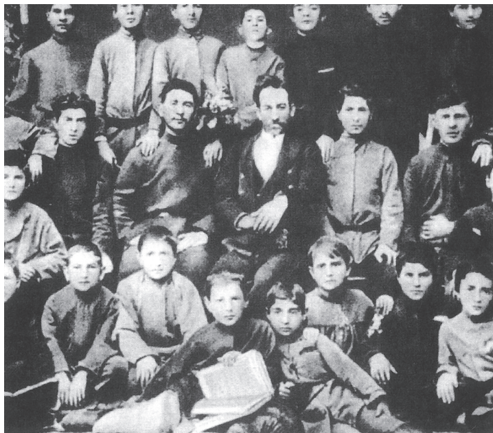
Žáci dobového semináře – Stalin v horní řadě uprostřed

dílel i na protivládních akcích, jako byly stávky či demonstrace, občas psal, dokonce i básně. Rozhodně chtěl svrhnout stávající řád nebo ho aspoň citelně poškozovat. Sám se jednou chlubil tím (uvádí to Chruščov), že se nejraději držel kriminálních, které považoval za „sůl země“.