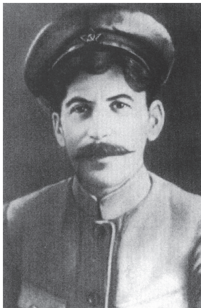
Stalin za občanské vátky 1918

aby byl pro své charakterové vady z tak vysoké funkce odvolán, jeho přání však nebylo vyslyšeno). Volkogonov na jiném místě 8 píše, že Stalinův prostý styl v sobě skrýval „hluboký primitivismus a intelektuální ubohost“. Tak se stalo, že byl Stalin od samého začátku v nejvyšším vedení strany a tím i státu, od léta roku 1919 byl členem politického byra. Tvořili ho v té době Lenin, Kameněv, Krestinskij, Stalin a Trockij, a i když docházelo pod Leninovou taktovkou k jeho postupné obměně, Stalin v něm nikdy nechyběl. Většinou jako jediný z vedení zasedal ještě v tzv. organizačním byru, kde měl na starosti realizaci, provedení a kontrolu přijatých závěrů. Proto Stalina málokdo znal, většina neměla o jeho činnosti ani ponětí a světový tisk ještě v roce 1924 komolil jeho jméno.