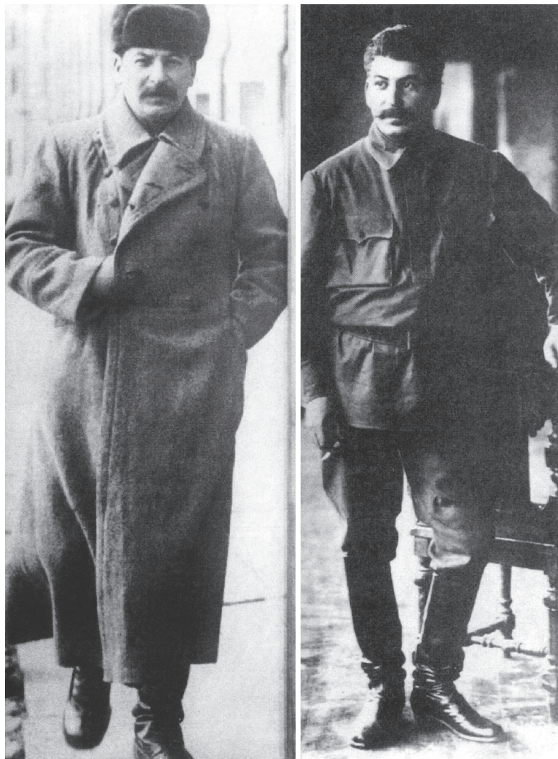
Stalin v plné síle ve třicátých letech

Hrál svou roli dokonale, především tvořil aparát a orgány a vybíral si lidi nezměrně oddané a ještě více poslušné, zmýlil se jen málokdy, a to jen zpočátku. Asi největším jeho úspěchem a „přínosem“ zároveň bylo, že dokázal leninský ústřední výbor, s nímž pracoval Lenin, nahradit stranickým aparátem. Když bylo pětiletí bojů u konce, disponoval nejen poslušným stranickým aparátem, ale dokonce i vlastním osobním sekretariátem, jenž velmi často přebíral otěže vlády. Od svých kolegů se lišil jednoduchostí, okázale předváděl nedostatek intelektuálního