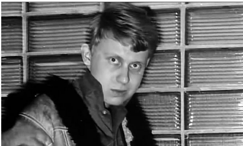
Ve středoškolských letech