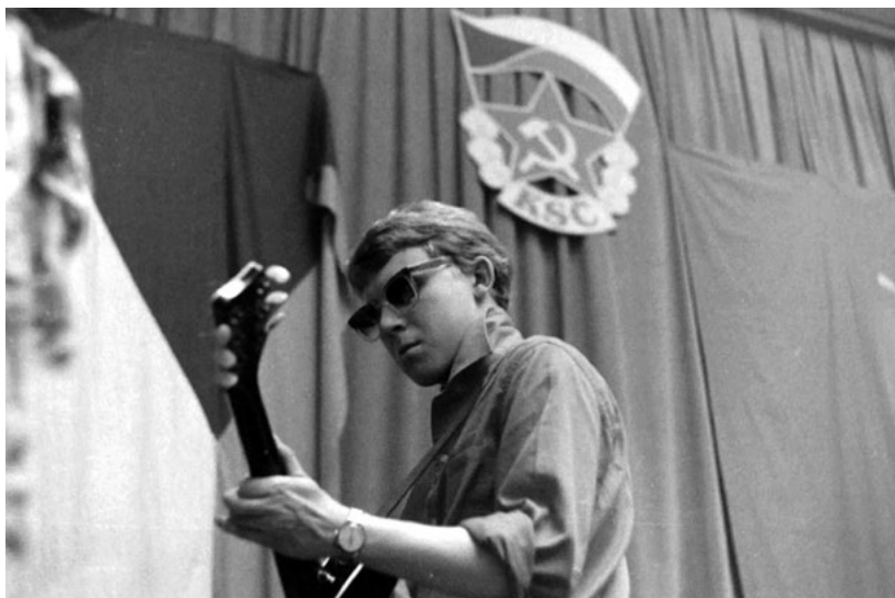
Občas se hrálo v bizarních kulisách jako například v Klubu novinářů v Pařížské ulici