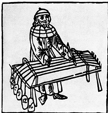
Pýthagorovy experimenty s hudbou, středověké vyobrazení