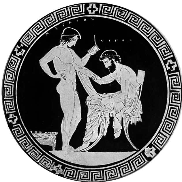
Pěvec Linos učí mladého Músaia, mýsa z 5. stol. př. n. l.

Pýthagorás a jeho žáci připisovali číslům kromě filosofických a geometrických významů i hodnoty mravní, a proto pomocí čísel rovněž vyjadřovali vztahy mezi lidmi. Tak například manželství označovali číslem tři, spravedlnost číslem čtyři a přátelství, které kladli nejvýše, číslem deset. Lidskou duši rozdělovali na tři části – chápavost, srdnatost (tu mají i zvířata) a rozumnost (tu má jen člověk). Část rozumná je nesmrtelná, ostatní složky jsou smrtelné. Pýthagorovská teorie čísel je spojením náboženských a vědeckých prvků, které někdy vyznívají fantasticky a tajemně, jindy podivuhodně, jasnozřivě a objevně.