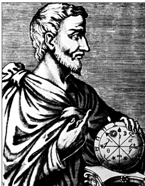
Údajný Pýthagorův portrét

nýbrž při jeho nakládání“, mělo odvádět lidi od lenošení a přivádět je ke konání ctnostných činů.