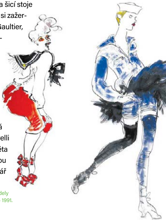
Reklama na úsměvné námořnické modely Jean-Paula Gaultiera, kolekce jaro/léto 1991.

Pohrát si s detailem dokázal například Thierry Mugler. Ramena ostře tvarovaných kabátků zvednutá jako krovky brouka připomínají styl Elsy Schiaparelli z konce 30. let. Tento návrhář-šprýmař, který do světa módy vstoupil v brilantním zeleném saku s plastickou orchidejí v knoflíkové dírci (frajerský secesní návrhář