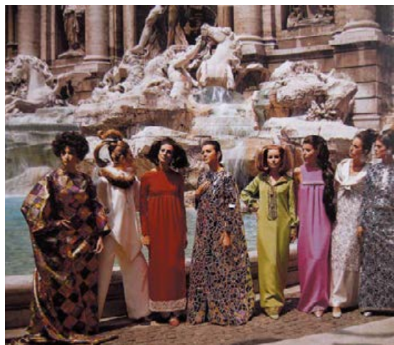
Italská móda se ve světě prosadila nejen díky stříbrnému plátnu, ale i modelkám fotografovaným na pozadí antických a renesančních památek. Fontana De Trevi s manekýnkami v maxi šatech a kombinézách zvaných „palazzo pyjama“, Řím, 1960.

Raf Simons předvedl před nedávnem kolekci pro Diorův salón jako retro Diorova slavného New Look z roku 1947. Prostě si jako řada dalších návrhářů zavzpomínal.