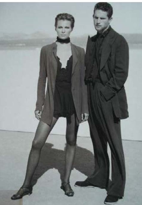
Giorgio Armani „změkčil“ tvrdou anglickou konstrukci pánského saka, ale současně ženy oblékaly do maskulinních minimalistických obleků.

můstkem k androgynnosti a který svými „baletními cvičkami“, nošenými při pódiových výstupech, ovlivnil tvarování pánské obuvi, např. zakulacené špičky, dnes značka Camper.