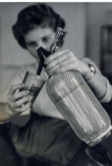
Sífonová láhev výrobního družstva Kovočas v Děčíně, 60. léta 20. století.

Móda je dnes jedním z nejproměnlivějších fenoménů. Po 90. letech 20. století, kdy jsme se oslnění náhle nabytou svobodou snažili dosáhnout svět, kdy moderní společnost vzhlížela k pokroku a hnala se kupředu za vidinou lepšího světa, přišlo vystřízlivění. Pojem fast fashion 1 dnes děsí všechny uvědomělé obyvatele této planety. Nejistá současnost i budoucnost přinesla hledání pevného bodu a obracení se do minulosti k osvědčeným značkám a výrobkům. Termíny jako nadčasovost a tradice dnes vzbuzují pocit jistoty. S tím souvisí i upřednostňování národních značek a výrobků. Ze všech těchto pocitů se zrodil jeden z fenoménů dnešní doby – retro.