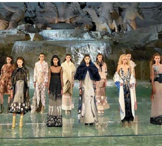
Přehlídka společnosti Fendi u příležitosti 90. výročí založení firmy, Řím, 2016.

bylo, že americké kopie francouzské haute-couture byly mnohdy dražší než originál. Záhy si couturiéři uvědomili, že je mnohem výhodnější prodávat po světě vlastní butikové kolekce než střihy. Z tohoto důvodu se zrodil veletrh modelové konfekce Prêt-à-porter . První generace stylistů, kteří se podíleli na vytváření modelových kolekcí, přijímala bez reptání, že zůstane anonymní, a spokojila se s prací pro dobře zavedené značky. Od sedmdesátých let však už stylisté začali vystupovat z anonymity, každý se snažil navrhovat pod svým vlastním jménem a místo jednotného trendu prosazoval každý své ego. V roce 1973 byla z podnětu Pierra Bergé, muže, který byl ředitelem salónu Yves Saint-Laurenta, založena odborová komora couturiérů a módních tvůrců.