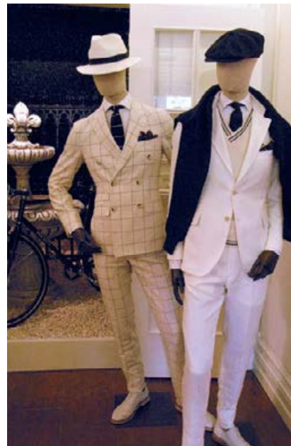
Londýnská firma Hackett představuje tradiční britský styl, veletrh Pitti Immagine Uomo, 2013.

Razantním zásahem do životního stylu byl na sklonku prvního desetiletí 21. století nástup nové, asertivní generace označené jako „generace Y“. Jejím krédem bylo: Chaos zabíjí, zbavme se laciných suvenýrů z cest, důvěřujme budoucnosti. Tito mladí se upnuli k futuristickému vzhledu souvisejícímu s novými technologiemi úprav a výroby, ale také s kosmickým leskem, kovovým vzhledem, „matematickou krásou“ tvarů a počítačovými vzory. Tato retro-modernost připomněla okouzlení současných návrhářů 60. lety, cestami do vesmíru, ale evokovala do jisté míry i „křížácké kosmické tažení“ glamového zpěváka Davida Bowieho. Generace Y objevila i Micka Jaggera, který byl pro Bowieho odrazovým