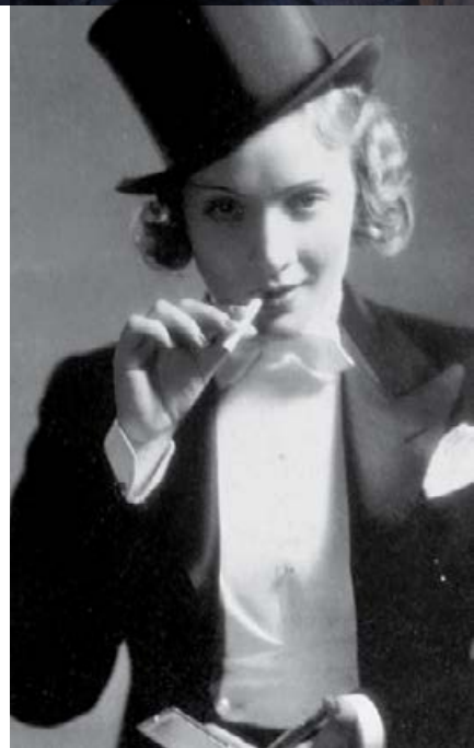
Chameleonka Madonna v kostýmu v pánském stylu podle Marlene Dietrich. Zhotoven byl tradičně v londýnské ulici Savile Row.