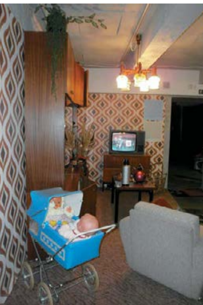
Interiér ze 70. let 20. století v expozici Retromuzea v Chebu, 2016.

jsou minulostí „jen“ inspirované. Všechny tři tyto zdroje dohromady vystihují současné trendy ve společnosti.