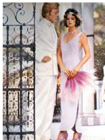
Ukázka retro módy 20. let z filmu Velký Gatsby , 1974.

Poslední britská královská svatba byla spojena s parfémy značky Grossmith, s vůní Betrothal, kterou měla v oblibě královna Viktorie. Výrobci flakonů samozřejmě používají historické lahvičky značky