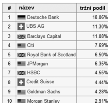
Tabulka 1.1 10 největších forexových obchodníků