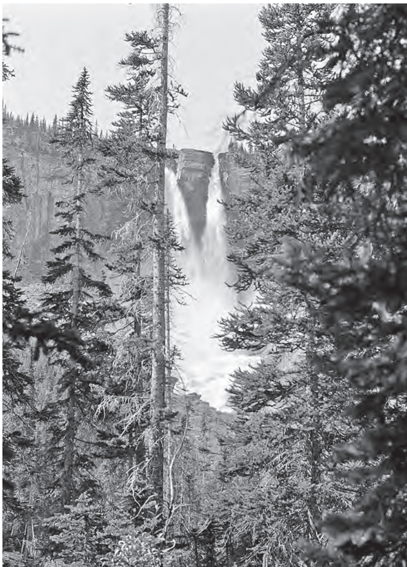
Vodopád Twin Falls (180 metrů) – dvojčata – Národní park Yoho