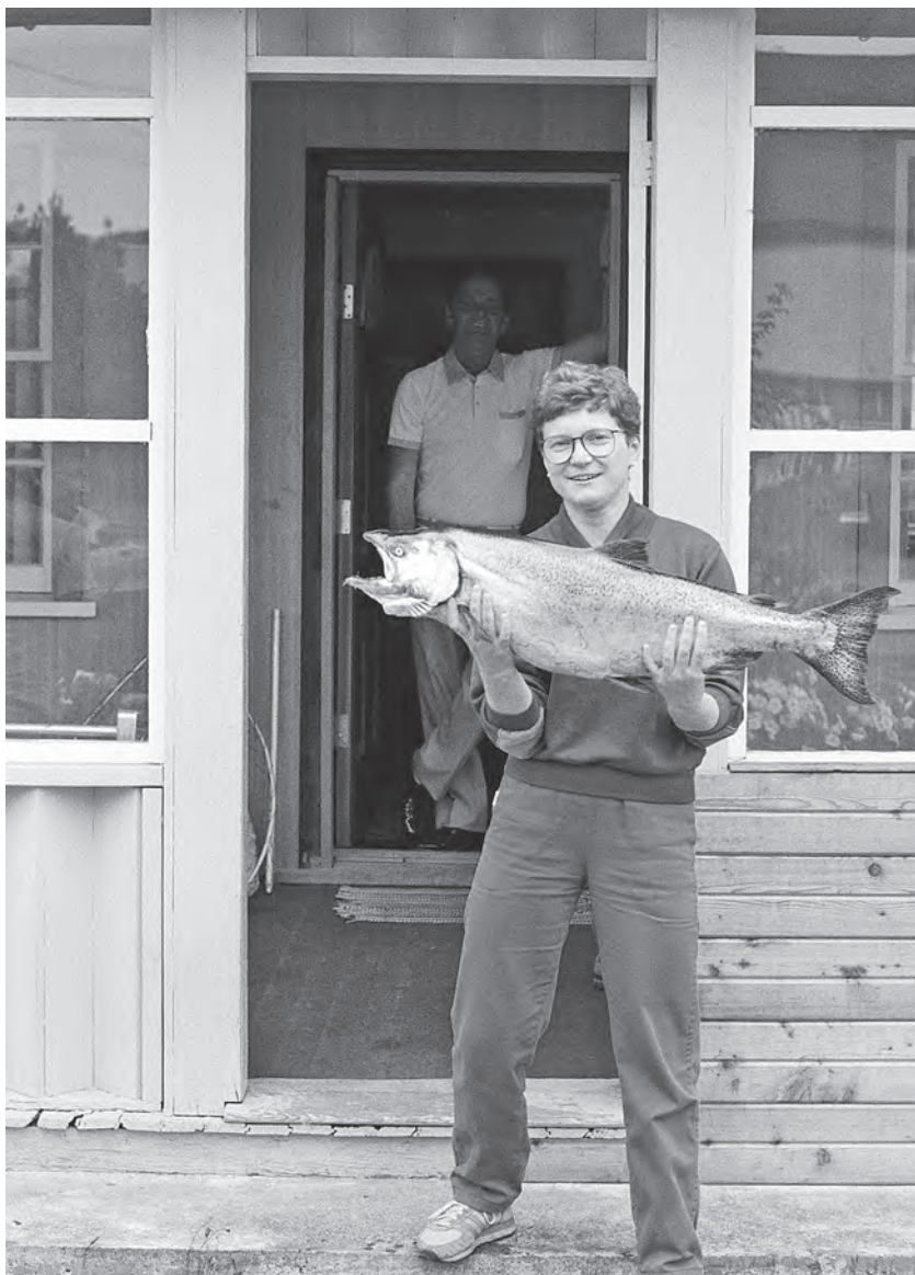
První losos z útesu