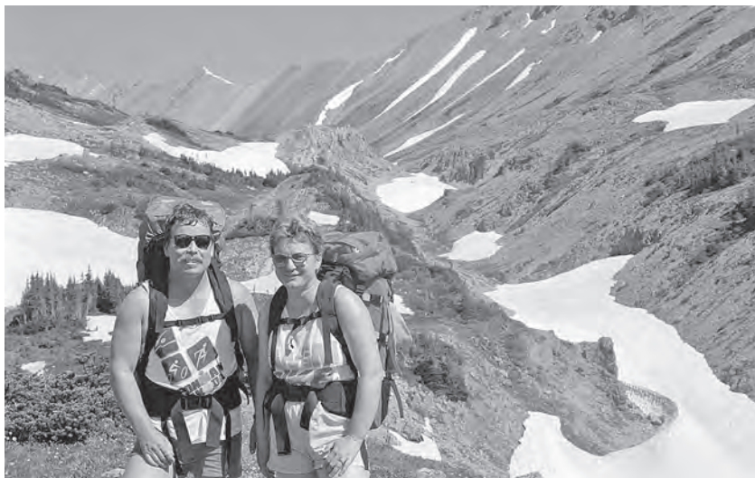
Stoupáme k průsmyku Mystic Pass