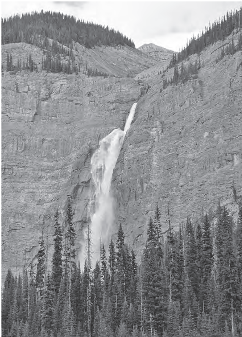
Vodopád Takakkaw Falls, 302 metrů, Národní park Yoho