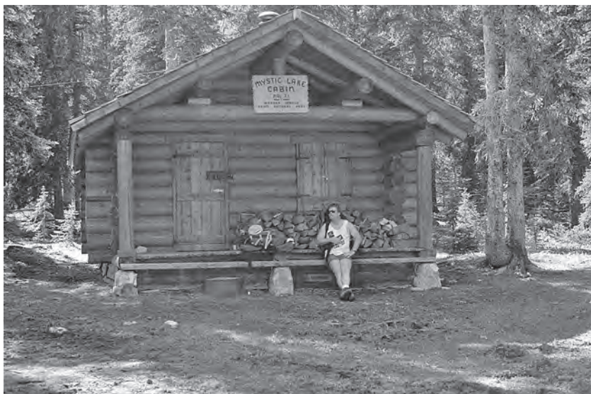
Srub hajného pod Mystic Lake, o 15 let později, opravený