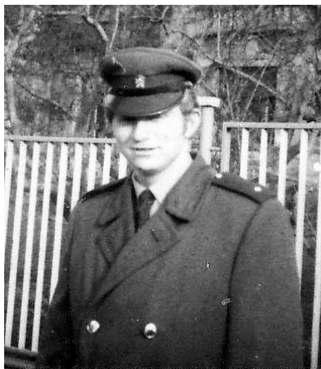
Moje první foto v policejní uniformě s nejnižší hodností „rotný.“

Já jsem nevěděl, z čeho se mám radovat dříve, zda z objasněné krádeže, či z očekávané odměny? Když si mne velitel pozval za dva dny na kontrolu spisů a chystal se mne zase „seřvat“ za nečinnost v případě krádeže motorky, jen mu spadla čelist, když držel v ruce skoro kompletní spis s předávacím protokolem odcizené věci a doznáním pachatele. Ten pocit docela malinkého vítězství nad velitelem byl skoro stejně slastný jako očekávaná odměna.