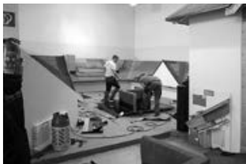
Obr. 1.002 Praktická část zkoušek izolačních materiálů

Dalším faktorem, který se u nás rozmáhá, jsou účelová jednorázová investiční „eseróčka“, založená na konkrétní investiční akci. Tyto firmy po ukončení akce, ale též před ukončením záruk zanikají a koneční majitelé nemovitosti nemají možnost záruky vymáhat. Účelem podobné společnosti je vydělat a zmizet.