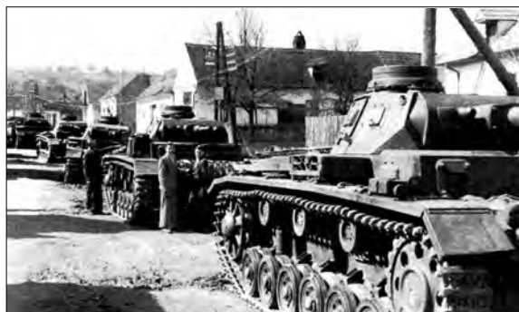
Francie duben 1941. V popředí tank Panzer III s krátkým kanónem ráže 50 mm