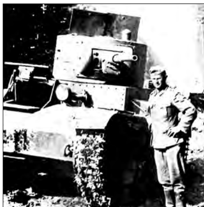
Sovětský tank T-26, model 1933, s kruhovou věží a kanónem ráže 45 mm