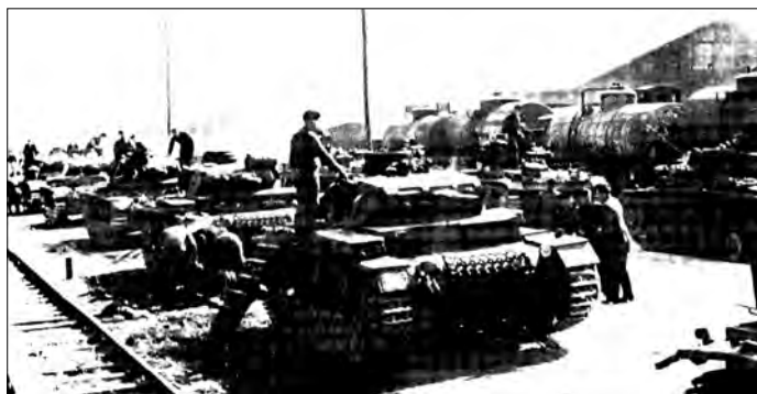
Vykládka tanků z vlaku. V pozadí cisterny s palivem