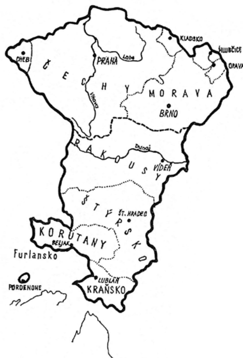
Obr. 2 Rozsah českého státu za panování Přemysla II. Otakara. Převzato z literatury [8]

o vznik zemských desek jako mimořádného nástroje k evidenci některých věcných práv k šlechtickému majetku; vzhledem k jeho významu se budeme tímto nástrojem podrobně zabývat později.