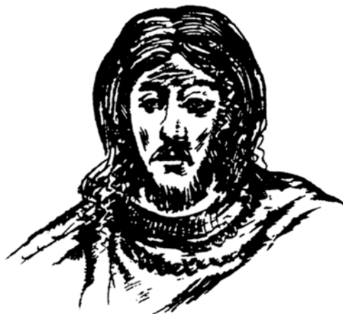
Obr. 1 Údajný portrét knížete Oldřicha podle fresky ve znojenské rotundě. Převzato z literatury [4]

První historicky doložené informace o sjednocení daňové politiky, tedy o vytvoření jakéhosi předchůdce pozdějšího katastru, pocházejí z roku 1022. V jedenáctém roce své vlády zavedl kníže Oldřich vybírání daně z polností – araturu. Technickou jednotku stanovující velikost daněné plochy tvořil lán , což představovalo plochu o velikosti dnešních asi 18 hektarů. Velikost usedlosti se tedy vyjadřovala v lánech a jeho zlomcích, ale počet lánů vycházel z přiznaných odhadů, takže cel-