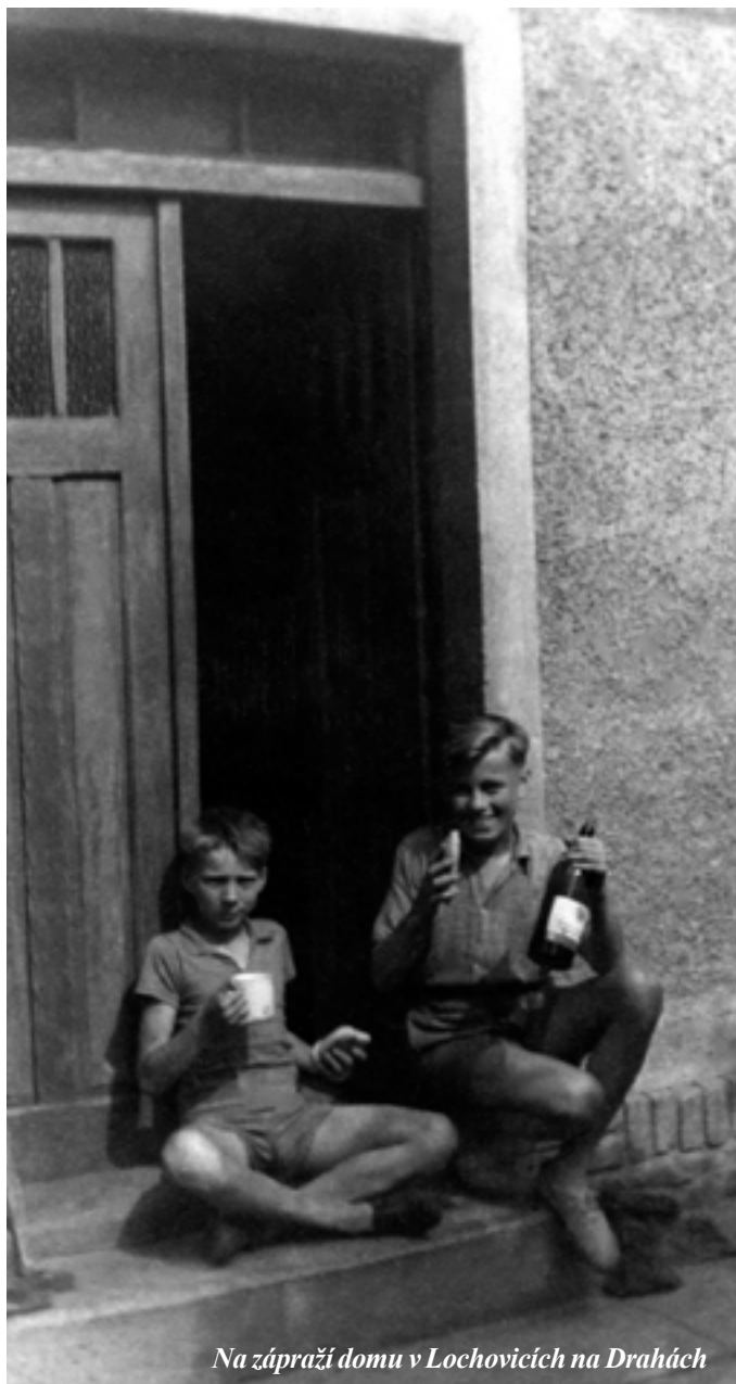
Na zápraží domu v Lochovicích na Drahách