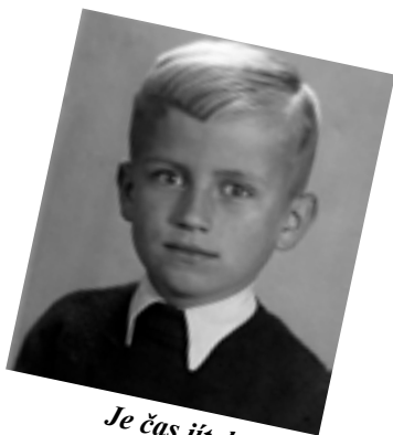
Je čas jít do školy