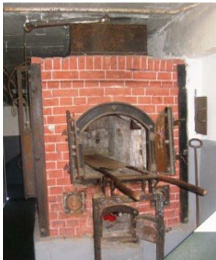
Jedna ze dvou kremačních pecí, které se zachovaly