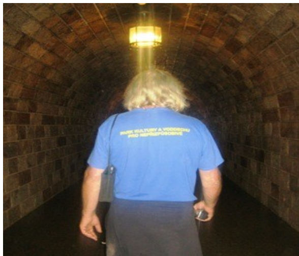
Další „voddecháč“ pro nepřizpůsobivý

Od konečné autobusů vede do skály vykutáný tunel o délce 124 m, z něhož o stejné délce se jezdí výtahem do budovy „Orlího hnízda“. Výtah je pozlacený, ovšem Hitler se jím jezdit bál. Proto byl na Kehlsteinhausu za celou dobu jen desetkrát. Názorná ukázka zbabělého trpaslíka s nafouklým vůdcovským egem!