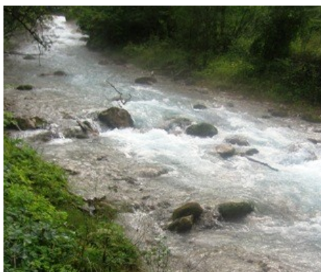
Dolní tok říčky Wimbach

Uvažovali jsme, že bysme do soutěsky v obřím horském údolí pod horou Watzmann nakoukli. V sevřených skalních stěnách se řítí divoká říčka. Z romantického výletu nakonec sešlo, cesta k soutěsce vedla neustále do kopce. Šárka už byla sice zmátořená, ale stoupáky nejsou pokaždé její parketa. Mně se ozývaly už opotřebované kyčle, které jsem letos poprvé ucítil, když jsem v lese nakládal těžká polena. Je jasné, že nějaký výstup ve francouzském Central Masiv, o němž jsem uvažoval, si budu muset už odpustit.