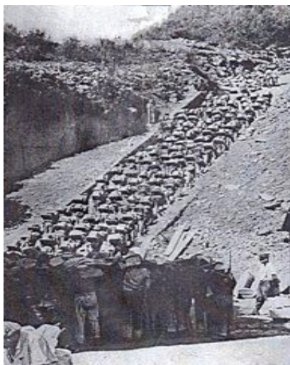
Veselý špacír mauthausenských šerpů

V prohlubni kamenolomu, kam jsme po „schodech smrti“ sestoupili, se nacházela ještě jedna „vychytávka“ nadčlovčeských elementů. Vysoká stěna nese název „Skála parašutistů“. Jak jsem se dočetl na pamětní desce, tak ji tak pojmenovali nelidské esesácké svině, které tady vraždili židovské vězně shazováním a nazývali je „parašutisti“. Nacističtí příslušníci národa Shillera a Goetha oplývali skutečně vyjímečným básnickým střechem!