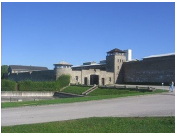
Koncentrační tábor Mauthausen

Někde za Neumarktem jsem na kraji lesa povečeřel dvě vejce navtvrd a Nivu. Lehce jsem si zajel po okresce č. 124, už jsem dlouho tudy nejel k Dunaji směrem na Enns, když jsem tudy dřív jezdil na Steyr za prací u Skaláka. Vrátil jsem se ty tři kilometry na silnici č. 123 a pokračoval podél pěkné řeky Aist už na jih k Dunaji k Mauthausenu. Zdejší koncentrák jsem doposud vynechával. Zatím mi stačily v Polsku Treblinka a Majdanek.