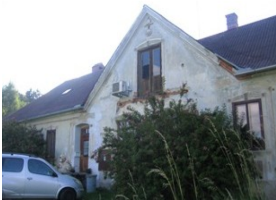
Statek v Blažkově

Vyrazil jsem ve čtyři hodiny odpoledne směr na Český Krumlov. Tam jsem potřeboval zajet do Komerční banky zaplatit elektřinu bez poštovního poplatku, což se mi podařilo jen o fous. Pak jsem to vzal kopci přes Přídolí pod horu Polušku, kde jsem na konci komunistických časů bydlel tři roky na statku v osadě Blažkov u Omleňky. Už jsem se tam delší čas nebyl podívat.