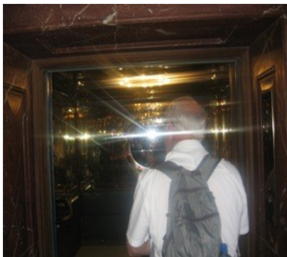
V tomhle zlatě měl Hitler sevřenou prdel!