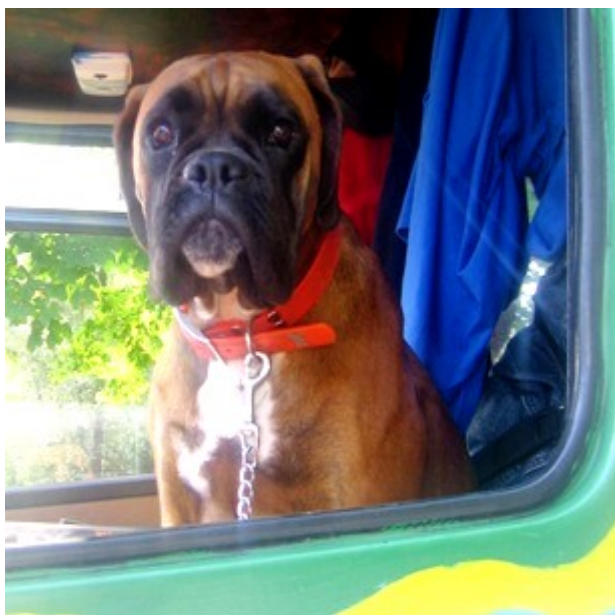
Zuzano, Zuzano, Zuzanooo!!!

Skaláci mají novou fenu boxera, když předchází Silona ukončila svůj život v rybníce, kde se utopila s pronásledovaným kozlem. Ta nová boxerská láska se jmenuje Zuzana.