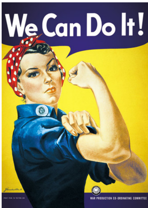
Obr. 2- Plakát – We Can Do It!