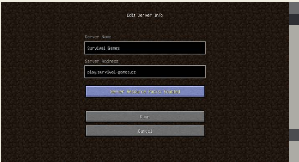
Obrázek 1.6 – Možnosti multiplayeru v nabídce Minecraftu

Přestože je naprosto správné a dostačující být ve svém světě o samotě a užívat si klidu, s dalšími hráči si můžete užít kopec další zábavy. Existuje několik možností, jak se při hraní spojit s ostatními. Ta nejčastěji využívaná je připojení se k již existujícímu serveru. Můžete také sdílet svoji hru s hráči ve vaší vlastní síti (LAN), ať už fyzické (například doma se sousrozenci), nebo virtuální, vytvořené přes pomocný software (např. LogMeln Hamachi). Další možností je využití Minecraft Realms – malých serverů naprogramovaných přímo Mojangem, které jsou ale placené zvlášť pomocí předplatného.