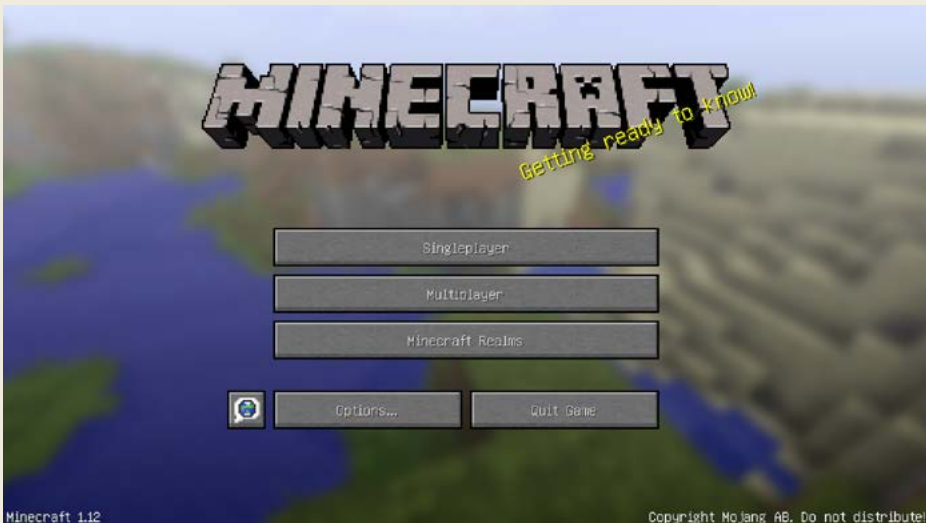
Obrázek 1.2 – Základní obrazovka Minecraftu s hlavní nabídkou – můžeme začít!

Po spuštění Minecraftu se dostanete do tzv. „launcheru“ – programu na spuštění různých verzí Minecraftu. Nejnovější verzi hry spustíte klepnutím na velké zelené tlačítko Play . Jiné