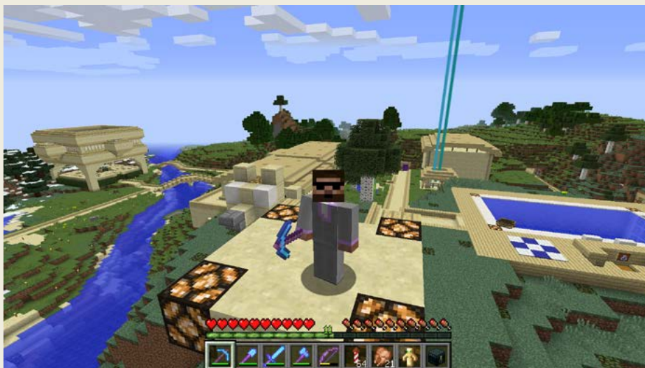
Obrázek 0.10 – Z tohoto místa se vám hlásím (skoro) každou neděli vždycky ve tři odpoledne

Navíc příručky, co jsou na trhu, se mi zdály zastaralé a myslím si, že ani jedna z nich není na nejnovější verze. A taky všechny vyšly původně v angličtině a neexistovala žádná česky psaná. No a další důvod je ten, že si opravdu reálně myslím (možná trochu namyšleně), že za těch šest let jsem nasbíral spoustu zkušeností, takže věřím, že mám hodně postřehů a rad, které můžu předat.