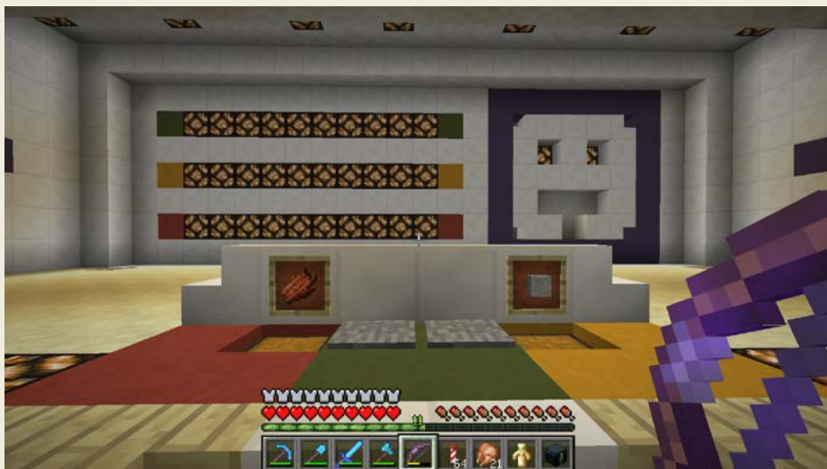
Obrázek 0.7 – Mazlík je spokojený a usmívá se

Jeden příklad za všechny je MAZLÍK. Nejedná se tedy přímo o můj nápad – možná je to přejaté odněkud, i když si nedokážu vybavit, kde jsem ten nápad viděl. Začal jsem pak tu myšlenku rozvíjet. Podle mě teda něco takového postavil Etho a já jsem od něj tu myšlenku