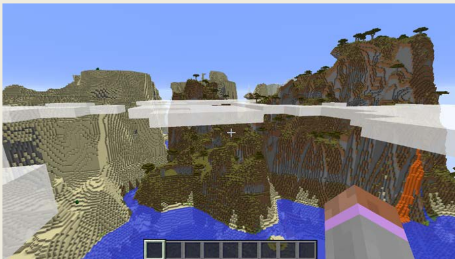
Obrázek 1.4 – Zesílený typ světa vypadá úchvatně, ale je náročný na výkon počítače

(tu upřímně řečeno nepoužívá skoro nikdo, protože to, co v ní najdete, si většinou můžete jednoduše sehnat hned první den).