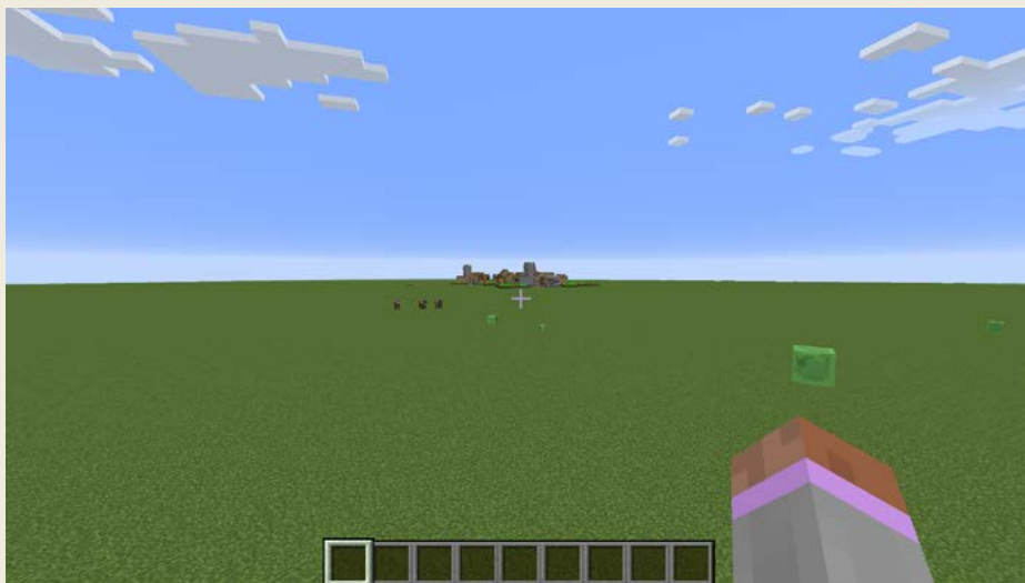
Obrázek 1.5 – Rovný typ světa je nudný, ale dobře poslouží k plánování staveb

(tu upřímně řečeno nepoužívá skoro nikdo, protože to, co v ní najdete, si většinou můžete jednoduše sehnat hned první den).