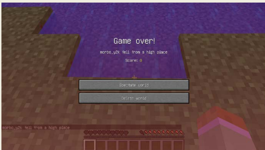
Obrázek 1.3 – Jedna smrt a konec – v Hardcore režimu se stresovat musíte