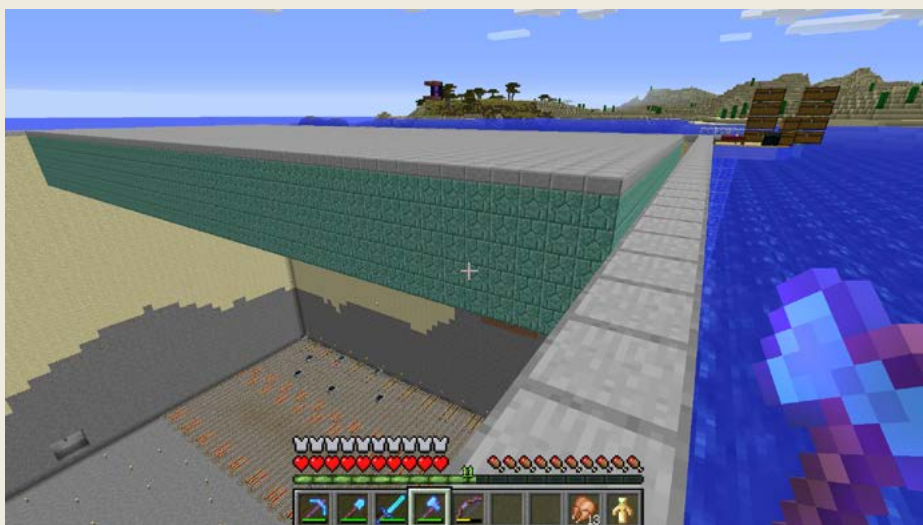
Obrázek 0.5 – Osudová guardian farma – asi nejnáročnější projekt

Kdybych se teď měl zaseknout na tom, že už mám všechno postavené, že už nic nepotřebuji, tak už jsem dávno skončil, ale je to i o tom, že se ty věci snažíš dělat lepší a lepší. Zvelebovat je.