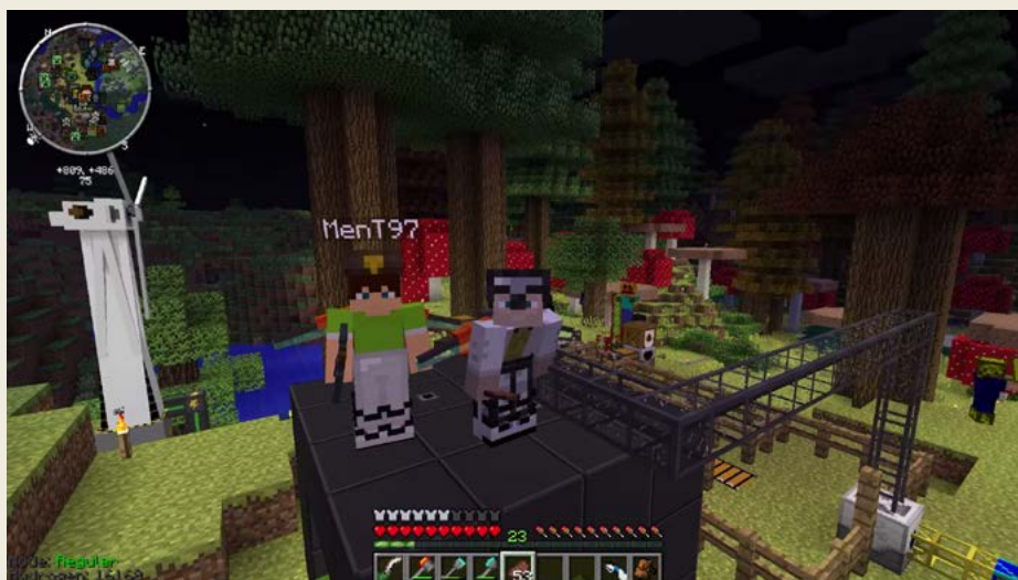
Obrázek 1.8 – Minecraft může díky módům vypadat úplně jinak