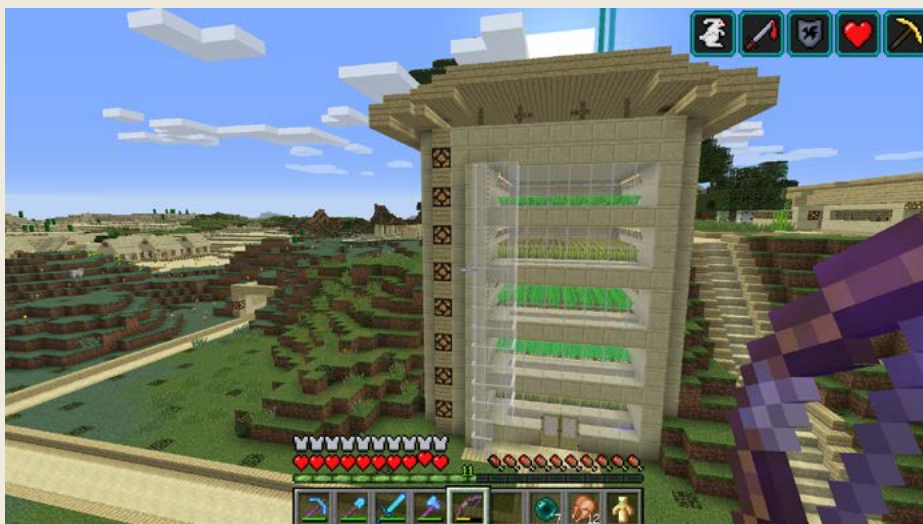
Obrázek 0.6 – Plně automatická farma na obilí

Kdybych se teď měl zaseknout na tom, že už mám všechno postavené, že už nic nepotřebuji, tak už jsem dávno skončil, ale je to i o tom, že se ty věci snažíš dělat lepší a lepší. Zvelebovat je.