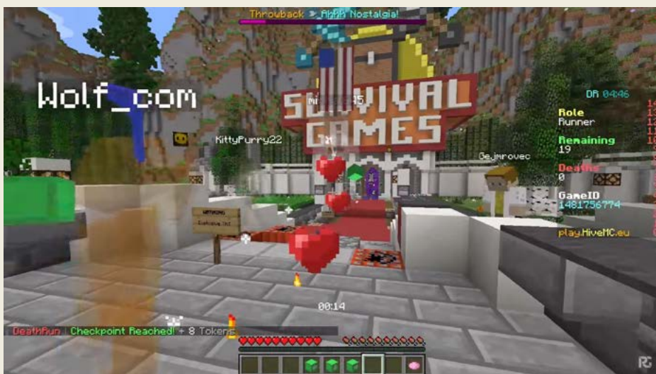
Obrázek 0.3 – Multiplayer je obrovský zdroj zábavy, hlavně různé minihry

To jsem měl takový stav, kdy mě to nebavilo, kdy jsem přemýšlel, že to ukončím. Ono je to jako na vlnách. Já nikdy nedělal zbrklá rozhodnutí. Vždycky, když mě toto potká, což už