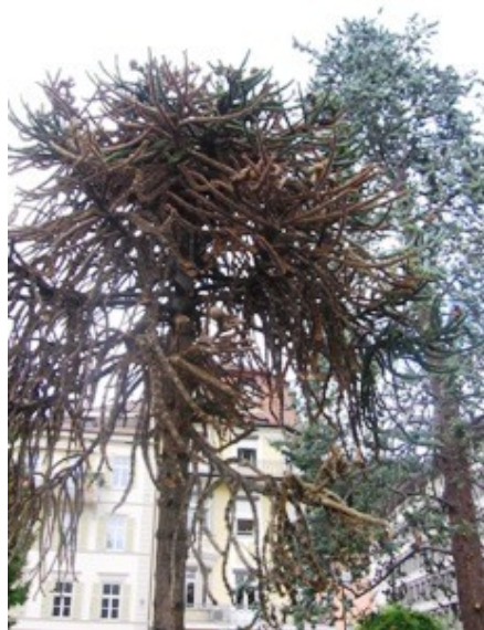
Ta chilská aurakárie jim tady nějak schne