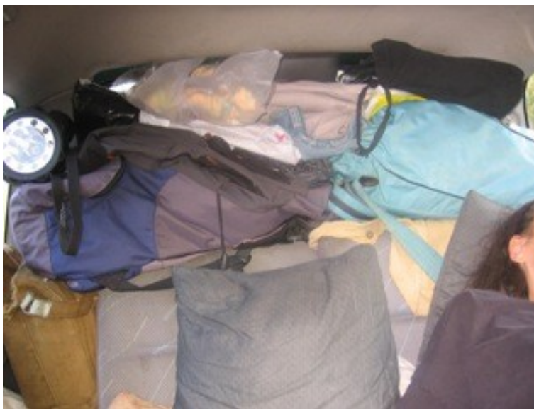
Takhle je narvaný zadek auta pro ložnici

Než se roztočí stočené deky se spacáky, musí se pod zadní sedadla vpravit opěrky hlavy, aby se dosáhlo roviny spací úpravy. To už ale opěradla předních sedadel musí být sklopená a pro zastrčení opěrek se musí vyvinut dost úsilí. Opěrky mi podávala Zdeňka, zatímco já se pral s nadzvednutím zadních sedadel. Během několika dnů se z nás stala sehraná parta, že jsme rozkládali spací úpravu i po paměti ve tmě. Nocležné je tím pádem zadarmo. S trochou nepohodlí proti spaní doma v posteli se člověk srovná během dvou tří dnů. Aspoň tedy já.