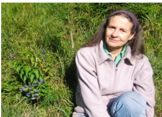
Posezení u hořce tolitovitého