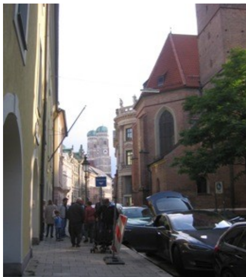
V pozadí báně kostela Frauenkirche