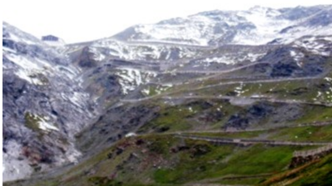
Passo del Stelvio (2.757m)